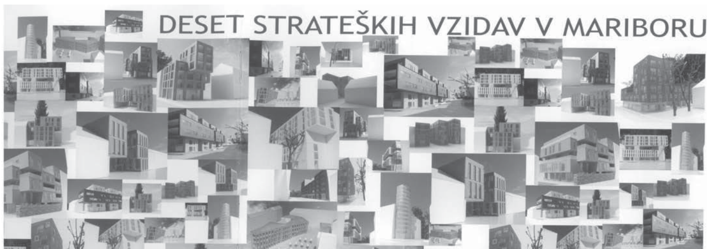
Slika 2: Razstava desetih strateških vzidav v starem mestnem jedru Maribora, predstavitev, odprta razprava. Projekti, izdelani na Fakulteti za arhitekturo v Ljubljani, v sodelovanju z Mestno občino Maribor, seminar arhitekture mesta, prof. Janez Koželj, september 2007 do november 2008. Metoda in princip dela /transparentnost + strateški cilj/prenova starega mestnega jedra.

Projekt Zimska Univerzijada, ki ga organizira mesto Maribor v sodelovanju z mestnima občinama Ruše in Zreče, bo spodbudil celotno izgradnjo turistične in športne infrastrukture ter etabliranje Maribora kot univerzitetnega