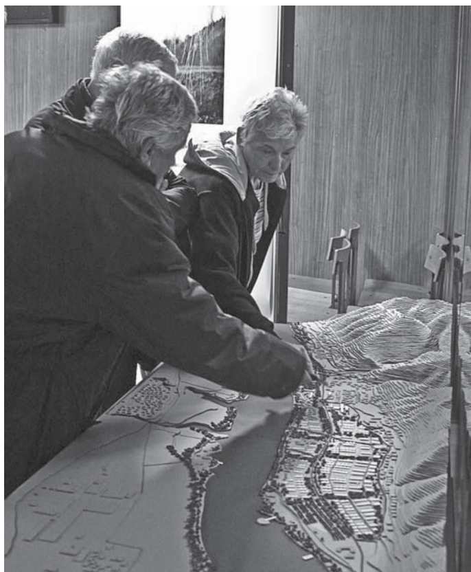
Slika 4: Sodelovanje krajanov pri nastajanju prostorske vizije za Mariborsko jezero. Krajanje so aktivno sodelovali tako pri pripravi izhodišč kot v samem procesu nastajanja. Zaradi kontinuiranega sodelovanja in strokovne argumentacije ter upoštevanja potreb in pobud je bila rešitev pozitivno sprejeta, april 2008.

Figure 4: Participation of local residents in the making of the spatial vision of Mariborsko jezero/Lake of Maribor. The local residents actively participated in the preparation of the starting points, as well as in the very process of making. Thanks to continuing participation, professional argumentation and the heeding of needs and initiatives, the solution was given a positive reception, April 2008.