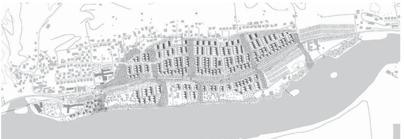
Slika 3: Prostorski načrt in strokovne podlage za območje prestrukturiranja sive mestne cone. Izdelano na podlagi koncepta urbanistične zasnove mesta Maribor in mednarodnega arhitekturnega natečaja. Centralne mestne funkcije z vertikalnimi poudarki, veznim grajenim tkivom ter izgrajena mestna prometna infrastruktura. Oblikovno, vsebinsko in prometno povezuje mesto Maribor v kompaktno strukturo, november 2008, avtor: AU arhitekti, Urbis, d. o. o.

Glede na to, da je naloga mestnega arhitekta v splošnem skrb za arhitekturni in urbanistični razvoj mesta, se zdi, da je pristojen za vse, kar se v mestu gradi. Dejstvo je, da se v mestu trenutno gradi na podlagi odločitev in rešitev, ki so bile sprejete v preteklosti in je delo usmerjeno pretežno v spremljanje in reševanje dilem,