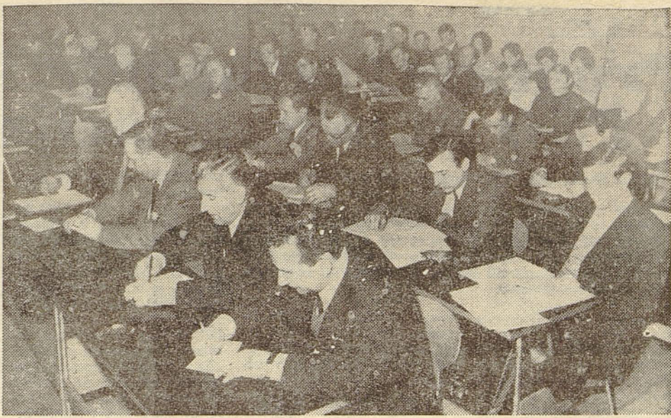
Pred kratkim je bil v »Elektromehaniki« Kranj občni zbor sindikalne podružnice, kjer so v referatih in razpravi poudarili napredek pri povečanju proizvodnje, kljub temu pa niso zadovoljni, kajti zastarele naprave in stroji jim onemogočajo večji vzpon. Spričo ostre konkurence je treba proizvodnjo čimprej modernizirati in uvesti sodobnejšo tehnologijo. Občni zbor je tudi opozoril na nizke osebne dohodeke saj s poprečjem 883 N din zaostajajo za mnogimi organizacijami oz. tovarnami. (Daljši članek o referatih in razpravi bo objavljen v naslednji številki)