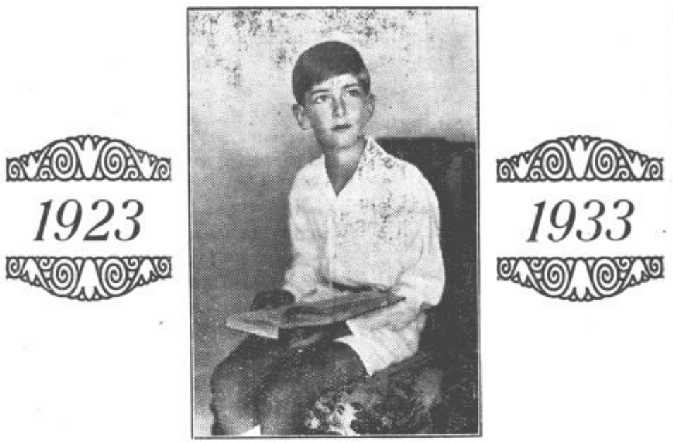
Dne 6. t. m. je dopolnil Njegovo kraljevsko Visočanstvo prestolonaslednik Peter, deseto leto Svojega mladeniškega življenja. Pred desetimi leti je v tem dnevu zablestela nova zvezda v Domu našega Kraljevskega Para, v radost in srečo Kraljevskih Roditeljev in v radost in srečo vsega jugoslovenskega naroda.

Prehranjevalna akcija je sedaj likvidirana v splošno zadovoljstvo.