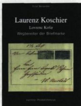
Naslovnici dveh knjig dr. Ernsta Bernardinija o Lovrencu Koširju

nebenbei erschließt sich dem Leser die Erkenntnis, daß zu einem sehr frühen Zeitpunkt die Idee zur Herausgabe von Briefmarken tatsächlich von Laurenz Koschier stammt, geboren 1804 im heutigen Slowenien. Auch wenn die „aufklebbaren Briefftaxstempel“ einen ganz anderen Zweck hatten als wie von Rowland Hill beabsichtigt und auch nicht ausdrücklich für den Verkauf an das Postpublikum vorgesehen waren, sondern vermutlich von den Postbeamten im internen Dienst verwendet werden sollten, um die Gebühreneinnahmen sichern und kontrollieren zu können, handelt es sich im Ergebnis bei dem Vorschlag von Koschier aus heutiger Sicht eindeutig um Briefmarken zur Kennzeichnung der Freimachung von Briefen.