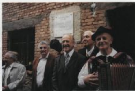
Obisk Koširjeve rojstne hiše v Spodnji Luši, 13. junija 2004