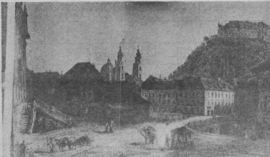
LJUBLJANA, KI JE NI VEČ

Informacije dobijo starši VVZ »Ana Zihelr«, osnovni šoli »Tone Čufar« in v krajevni skupnosti Kolodvor, Moša Pijadejeva 22.