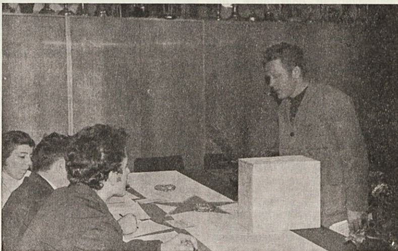
Glasujem za prispevek za razvoj šolstva v občini