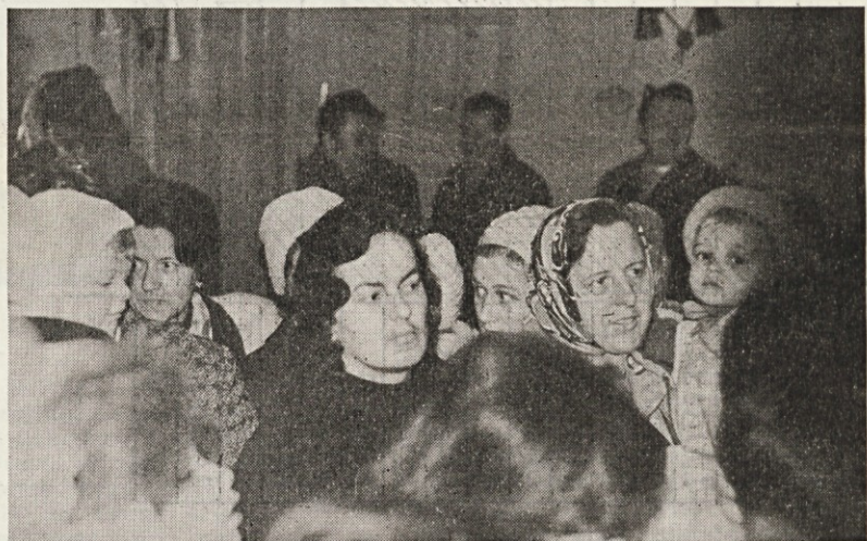
Kako so zaverovani — mamice z malčki pričakujejo kdaj jih bo poklical dedek Mraz

Vodstvo sindikata, predvsem pa mladinska organizacija, bi morala za ta cilj stopiti v konkretno akcijo. Če bi se delavcu pravilno pokazale vse posledice pasivnega odnosa do strokovnega in splošnega izobraževanja za njegovo življenje, bi najbrž drugače razmišljal. Cilj sindikata in mladinske organizacije bi moral biti torej posvečen tudi tem pro-