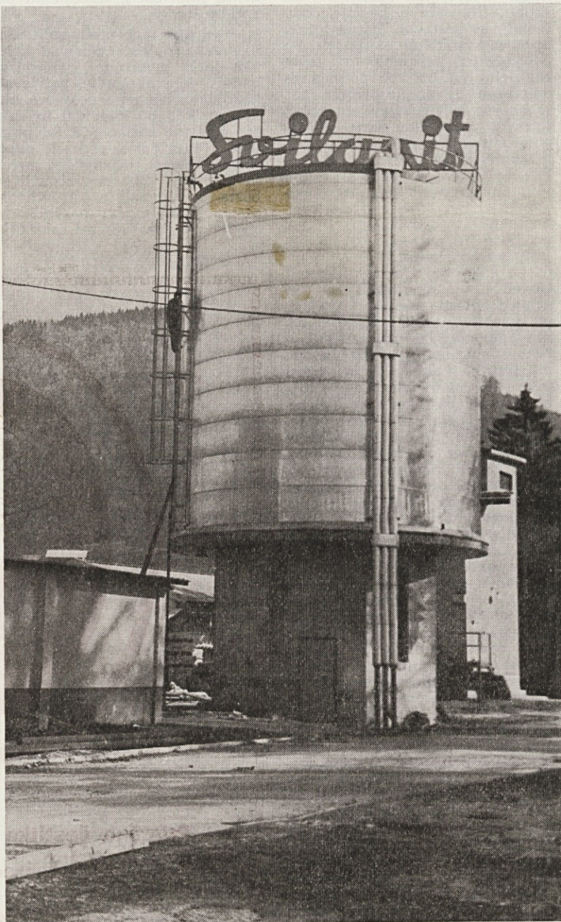
Cisterna za tehnološko vodo z učinkovito reklamo