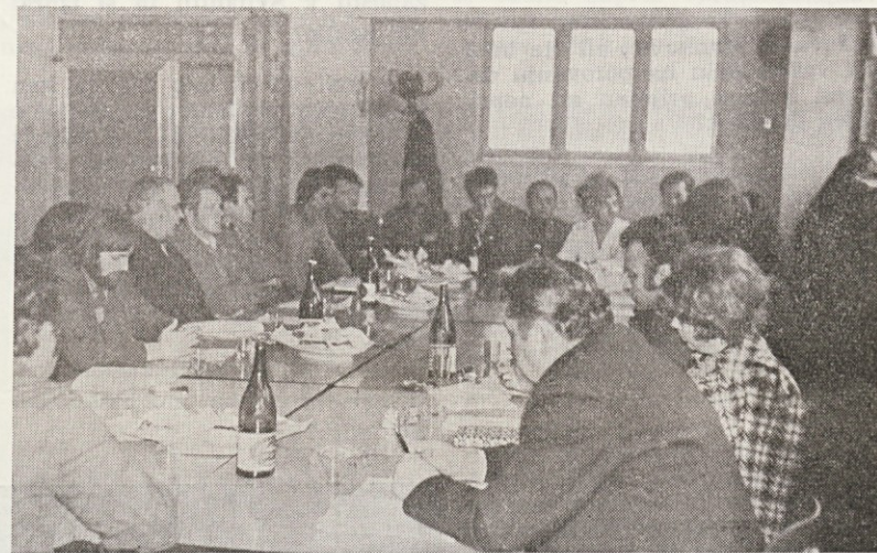
Prva seja DS TOZD Frotir

Če višina poprečnega osebnega dohodka v temeljni organizaciji združenega dela ali drugi organizaciji kot posojiljemalcu presega poprečni osebni dohodek na zaposlenega v republiki, se predpiše progresivno višja lastna udeležba.