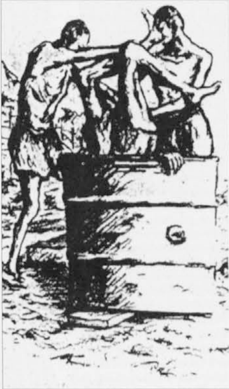
Nidjo Erce: Dušitev v kadi (tuš)

Otok je odkril tedanji jugoslovanski notranji minister Krajačić in to predlagal Kardelju. Ta je skupaj z najvišjim partijskim vodstvom sprejel odločitev za odprtje delovnega taborišča "centra za pre-