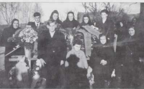
Na očinom pokapanji 1949-oga leta, 2-lejtna Irenka v prvom redej, prva na pravi strani, najmenjši, na srejdik je 6 lejtni lmi

Vi ste meli samo eno izo. Tistoga reda so eške doma