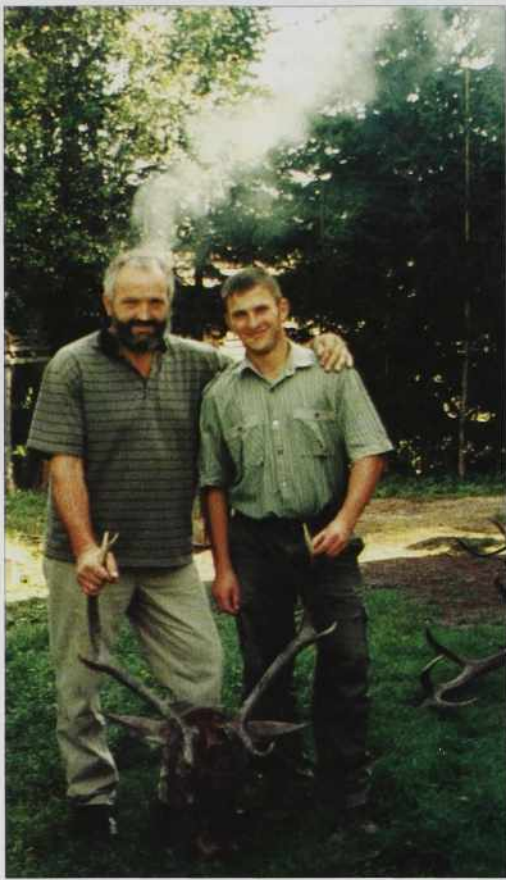
Nemci samo ore odnesejo

"Vala Baugi, do tega mau se je eške nika nej zgodilo. Do-sta pisauv mammo pa tisti na-