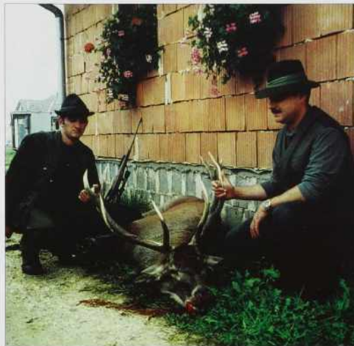
Srečna djagara, Talanin Gabi na levi strani

„Mi živino polagamo pa zve- kšoga tam vsikdar vōpride- jo. Istina, ka se je že tašo tō zgodilo, ka smo je mi samo polagali, depa vodnek so