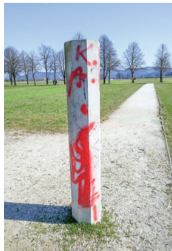
Pomazani steber na Poti tovarištva in spominov

Tudi tokrat vandali niso počivali. Odstranjena je bila plošča kurirski postaji na Taležu na Jelovici. Ker je gospa na ZVKD v Kranju na dolgotrajni bolniški, ne vemo, kaj se dogaja s prijavo. Znova je vandaliziran spomenik partizanskim kolesarjem v Šiški v Ljubljani (okrogel betonski steber z 28 imeni). ZB je že ukrepala. Pomazan je bil tudi steber ob Poti spominov in tovarištva v Ljubljani – in tudi ekspresno očiščen. Poškodovan je napis na spomeniku Stanetu Žagarju na Planici nad Crngrobom. Z macolo je bil uničen spomenik na Pasji ravni (zidan ste-