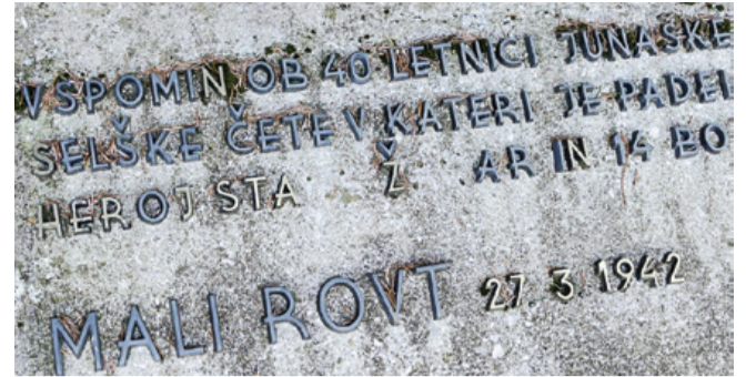
Poškodovani napis na spomeniku Stanetu Žagarju na Planici

ber s ploščo). Zlikovci so gotovo tisti, ki so lani tam blizu zmerjali udeležence pohoda v partizanske Dražgoše. Policija bi jih lahko zaslišala, če ne bi imela preveč opraviti z dijaki, ki protestirajo zaradi zaprtja šole.