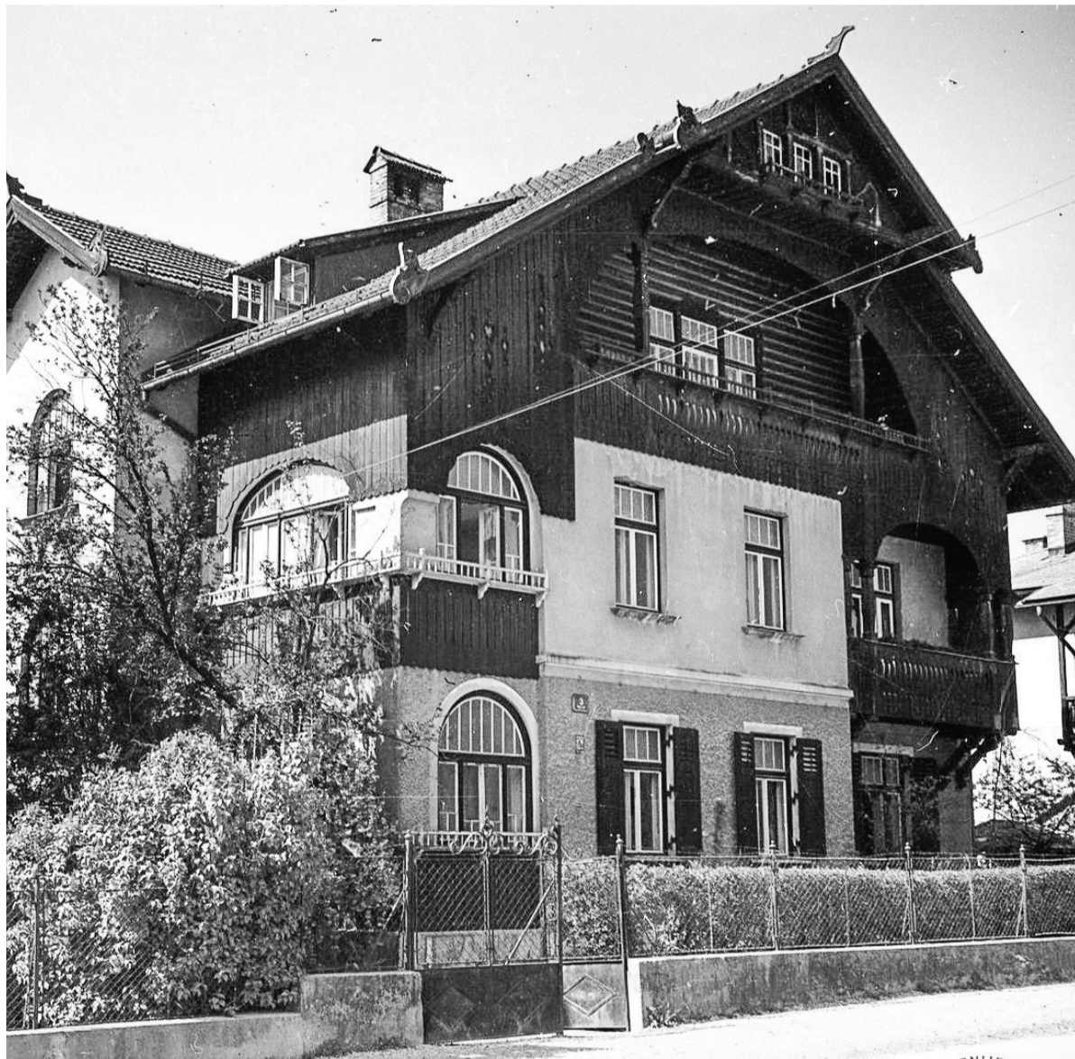
Hiša pisatelja Josipa Vidmarja, kjer je bila ustanovljena OF.

3. Druga svetovna vojna ni bila navadna vojna in vojaška okupacija naših krajev ni bila navadna okupacija. Šlo je za veliko več: to je bil apokaliptični spopad svetovnih razsežnosti, ne nazadnje so se kršitve mednarodnega prava dogajale v obsegu, kakršnega ni poznala nobena prejšnja okupacija. Šlo je za