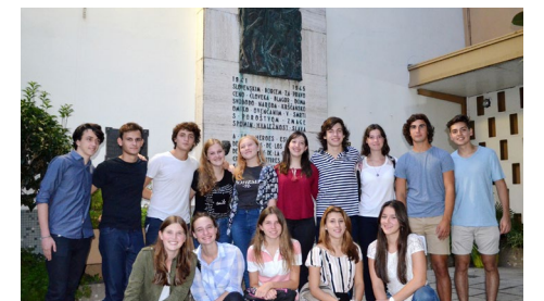
Petošolci leto 2019