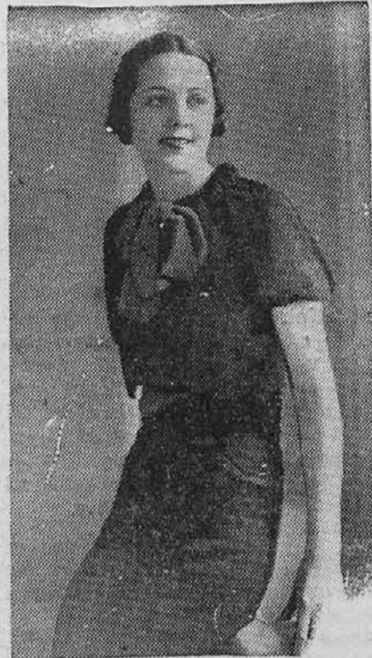
Obleka iz črnega krepa s pasom iz velurja in ovrtnikom