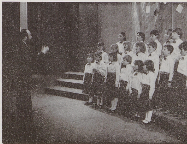
Pesem mladih v Kulturnem domu v Trstu: otroški zbor »Valentin Vodnik« iz Doline (levo) in otroški zbor »Zvonček« z Repentabra (desno)