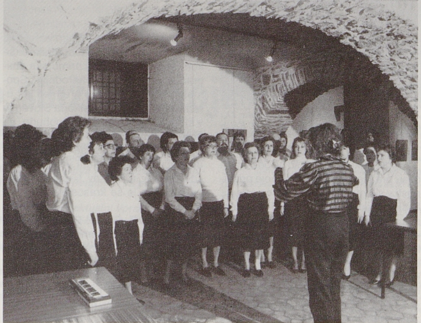
Ob odprtju 7. ricmanjskega tedna je uspešno nastopil mešani pevski zbor »Skala« iz Gropade

Od 12. do 14. marca so bile v Cankarjevem domu v Ljubljani kulturne prireditve Slovencev iz Madžarske. Pod naslovom Porabje danes so se zvrstili odprtje etnografske razstave, glasbeni in folklorni nastopi, okrogla miza in zaključna prireditev, na kateri je nastopilo 169 rojakov najmanj poznane slovenske manjšine. Z dnevi porabskih Slovencev, ki so pokazali na hude probleme, ki pestijo to skupnost, se je končal že drugi krog vsakoletne predstavitve ene izmed slovenskih narodnostnih skupnosti v Avstriji, Italiji in Madžarski v Cankarjevem domu.