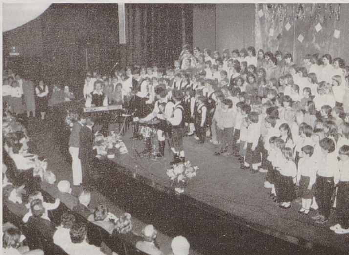
Mladinski zbor »Zvonček« z Repentabra (levo) in skupen nastop nekaterih zborov med izvedbo pesmi »Mojo srčno kri škropite« pod vodstvom Franca Pohajača in ob spremljavi ansambla »Zvezde« (desno)