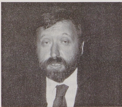
Prof. Dimitrij Rupel