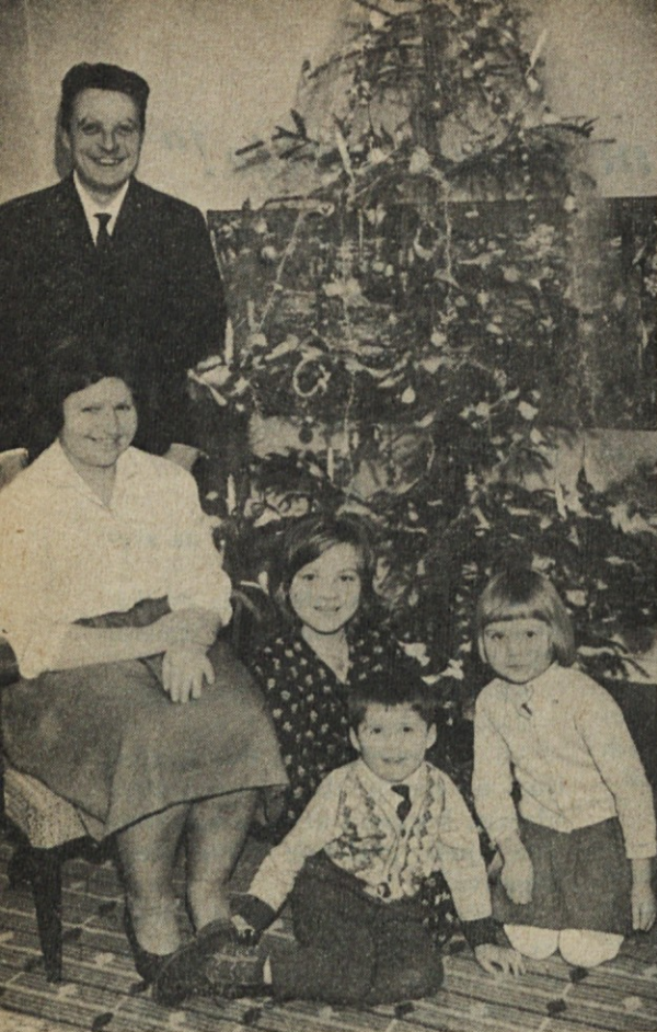
„Z veseljem smo lani čakali svetega večera“, nam piše Jamilškova družina iz Švedske.

Mi vsi smo sinovi in hčere nebeškega Očeta ter bratje in sestre v Detetu, ki ga s spoštovanjem pozdravljamo v jaslicah.