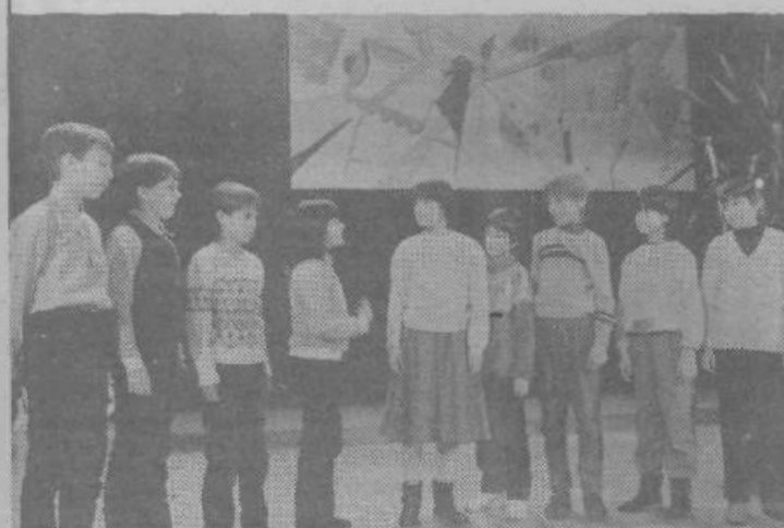
Nastop učencev naših osnovnih šol