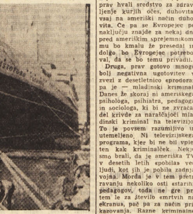
Zaradi stavke pristanjskih delavcev v ZDA si je mostov italijanske ladje «Cristoforo Colombo» moralo celo pri privezanju ladje pomagati kar samo...