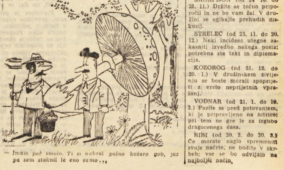
...Inim pač smola. Ti si nabral polno košaro gob, jaz pa sem staknil le eno samo...