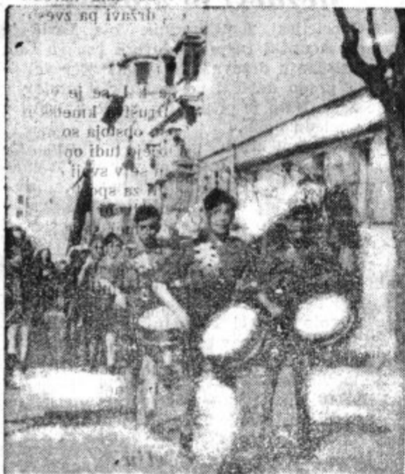
Fasizem oznanjajo zdaj v spanskem Maroku z bobni. Slika nam kaže skupino takih mladih bobnajočih fasistov.

Češko-slovaška vlada je že prepovedala uvoz vojaških potrebščin, Nemška vlada pa je izdala dva nova zakona, naperjena proti slovanski so-