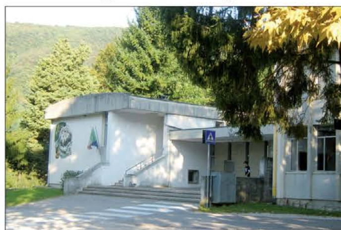
Sedež nižje srednje šole Dante Alighieri v Špetru

zred 6 dijakov, na italijanski šoli v Špetru 25 dijakov, na dvojezični šoli pa je prvošolcev 19.