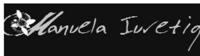
Associazione artisti della Benecia Društvo beneških umetnikov

vernice della mostra _ otvoritev razstave