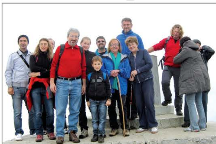
Insieme sulla cima del Matajur e poi nel rifugio Dom na Matajure