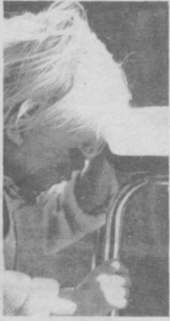
Babica, ki verjetno deli menenje mnogih

Kako čudovita učna ura! Delali so vsi. No, le najmlajši so sedeli v »parterju« na prostem in občudovali zdaj