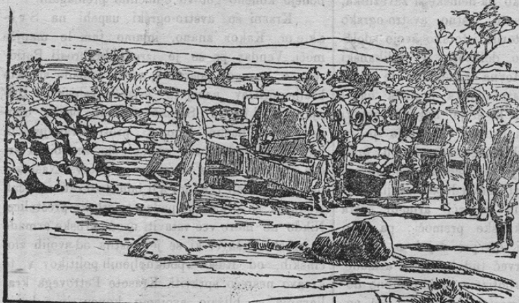
Artillerie der Buren.

imajo sicer še malo artiljerije, ali gotovo je, da bodo v bodočih bojih Angležem prijazni podkupljeni vladi še več kanonov vzeli. Naša slika kaže bursko vstaško artiljerijo.