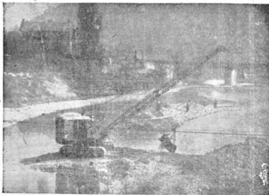
Kmalu bodo Savinji odprli pot v novo korito na celjskem ovinku. V ponedeljek bo priskočila na pomoč ekipa JLA z 2 bagroma in 3 buldozerji. Ta ekipa je doslej delala pri regulaciji Sotle. — Na sliki gradnja začasnega praga pred kapucinskim mostom, da bi ga poglobljena Savinja ne spodnesla.

Drugi dan razstave, to je v nedeljo ob 9. uri, bo tudi zborovanje sadjarjev in vinogradnikov v dvorani Narodnega doma v Celju.