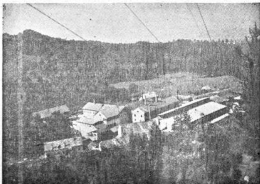
Tovarna keramičnih izdelkov Liboje

Pred dnevi je gozdno gospodarstvo Nazarje dokončalo šest kilometrov nove gozdne ceste od Duple pri Lučah do Rastke. Cesta je urejena za prevoz lesa s kamioni. Njena izgraditev omogoča racionalno izkoriščanje okoli 4500 ha gozdnih površin, ki jih bodo še letos začeli izkoriščati. Investitor te nove ceste je Gozdna uprava v okraju Celje, ki je vanjo investirala 56 milijonov dinarjev iz sredstev gozdnega sklada. Teh šest kilometrov ceste je samo prva polovica ceste na Raduho. V bodoče bodo nadaljevali gradnjo ceste od Rastk na Belo peč ter naprej na Crno. Cesta bo torej od Duple do Crne dolga 10 km.