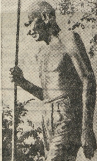
Bronast kip Mahatme Gandhija, ki so ga pred kratkim postavili v indijskem mestu Baroda

120 milijard je zelo visoka številka, vendar pa je to le na nacionalnega vsega italijanskega primerjamo te številke z drugimi, bomo videli, da potroši povprečen italijanski državljan razmeroma mnogo več, ne spadajo v rubriko nepoštenih najnižnjih življenjskih potrebščin ali v enajst milijard.