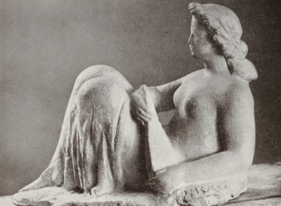
FRANCISEK SMERDU : Relief matere z otrokom — okrog l. 1942 Bakantka — okrog l. 1950 Zena z lutnjo — okrog l. 1940 Mali ženski akt — okrog l. 1943