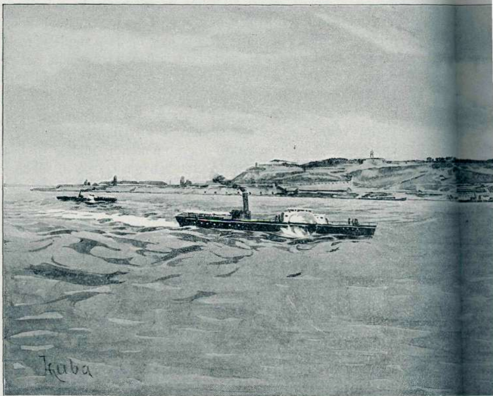
Pogled na Belgrad s hrva

Spoznal je, zakaj prej ni mogel najti resnice. Mrtvo je bilo njegovo življenje. Ko se je v nenravnosti in v grešnem uživanju vpraševal, kaj je njegovo življenje, si ni mogel odgovoriti družega, kakor: „Zlo.“ Zdaj pa je spoznal, da je namen človekov na zemlji, izveličati svojo dušo, izpolnjevati božje zapovedi, trpeti, ljubiti bližnjega in odpovedati se vsem nasladam. Posvetil se je