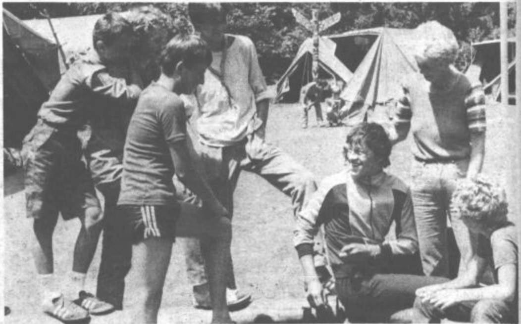
Prihodnje leto že 20 let tabora