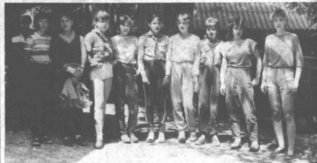
Pevski zbor nam je zapel nekaj taborniških (vos)