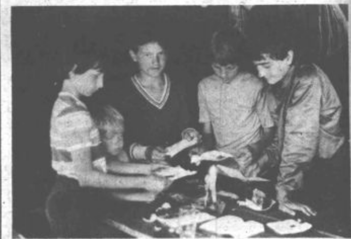
»Iz čebule stisneš sok...«