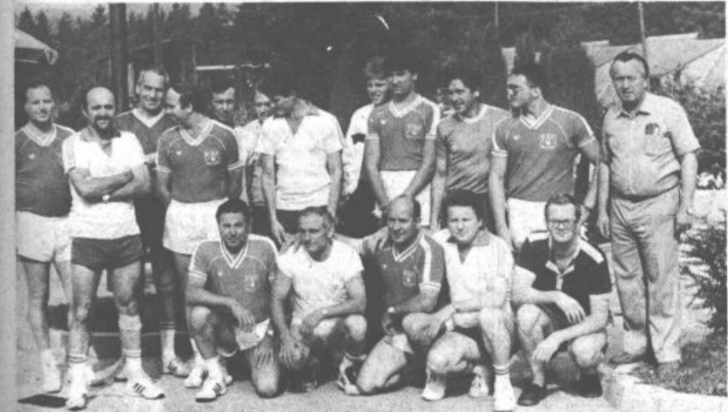
Kdo je zmagal ni pomembno, važno je, da so vsi veseli in zadovoljni

Zadovoljstvo je obojestransko. Predstavniki vseh treh mest so si izmenjali spominska darila, navezali nove osebne vezi in stike, ki jih nekoliko ovira le znanje jezikov. Ker načrtujejo vsakoletno izmenjavo obiskov in stikov, bodo oboji poskrbeli, da bodo po svojih močeh in v kar največji meri skušali odpraviti tudi to prepreko. Ob glasbi torej tudi šport in prijateljstvo ne poznata meja.