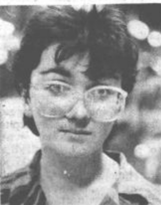
skrinjah, sedaj pa brusim obode. Zadovoljna sem z delom, pa tudi

sicer se ne pritožujem. Vendar pričakujem, da boljše doma.«