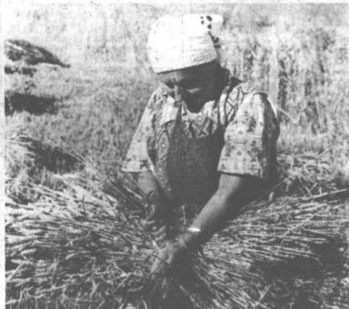
... Kaj bi bilo, če bi se tudi kmetje poživžgali na naravo in njene zakonitosti. Marsikje ne bi bilo nič, ker bi bili v prenekateri restavraciji gostje kljub temu lačni