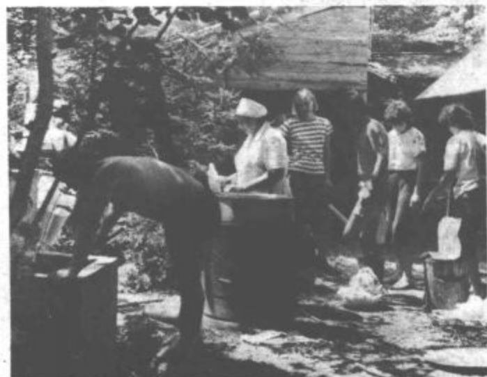
Opravili so več kot 12 tisoč prostovoljnih ur