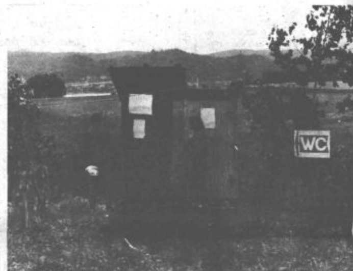
... Obiskovalci restavracije in jezera niso bili le žejni in lačni, ampak niso vedeli, kam z odvečno tekočino. V Škale, kjer so gasilci mislili na vse, pa je bilo predaletč.