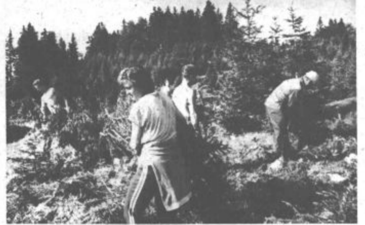
Pri čiščenju planinskih pašnikov na Menini so se mladi brigadirji zares izkazali

Zaradi številnih težav in nedečnosti pri organizaciji mladinskih delovnih akcij v širšem merilu, pa tudi zaradi problemov pri pridobivanju brigadirjev, so se mladi v mozirski občini letos odločili, da bodo delali doma, tu pokazali svojo prihost in uspešnost ter s tem zagotovili večje zanimanje za mladinsko prostovoljno delo. S sodelovanjem drugih so se torej odločili za mladinsko delovno akcijo »Menina 85«, katere osnovni namen je bilo čiščenje planinskih pašnikov na tej prostorni planoti.