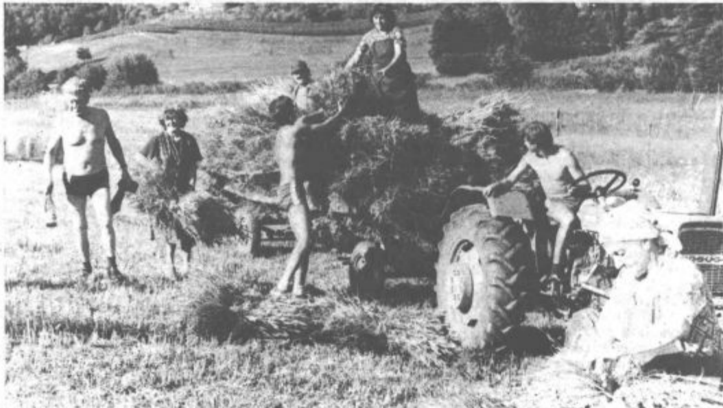
Praznični lep ponedeljkov dan so kmetje izkoristili za žetev pšenice. Gornji posnetek smo naredili v Bevčah.