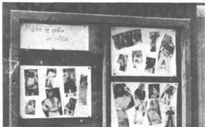
... Zato pa na turistično sezono mislijo mladinci OO ZSMS Šoštanj. Njihovi člani so zelo dobro obveščeni z »mođa je prišla in odšla«.