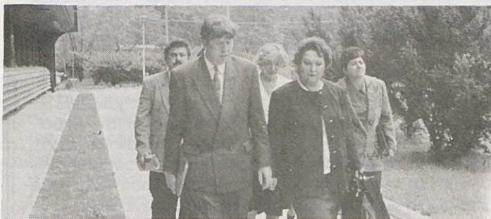
Ministrice za delo, družino in socialno politiko Jožica Puhar na obisku v Gorenju

strici razložil kadrovske in izobraževalno politiko Gorenja Gospodinjski aparati v zadnjih letih in opisal težave, ki pri tem nastajajo, zaradi nedorečene zakonodaje in čudne pravne prakse. Ob tem, da se je število zaposlenih zniževalo na različne načine, kot je bilo poudarjeno na pogovoru, za večino na "neboleč" način, v glavnem z upokojitvami, sporazumnimi odhodi z dela, samozaposlovanjem ali kako drugače, so v Gorenju Gospodinjski