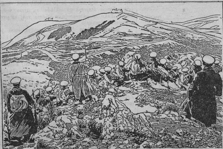
Bulgarische Infanterie im Feuergefecht.

Opozarjamo čitatelje na naša poročila o vojni na Balkanu. Bulgarski armadi se mora priznati, da je z naravnost junaško hrabrostjo dosegla nepričakovano velike uspehe. Pomisliti se mora, da se je v kljub modernim puškam bitke večinoma z bajonetom odločilo. Naša slika kaže bulgarsko infanterijo v bojih okoli trdnjave Adrianopol.