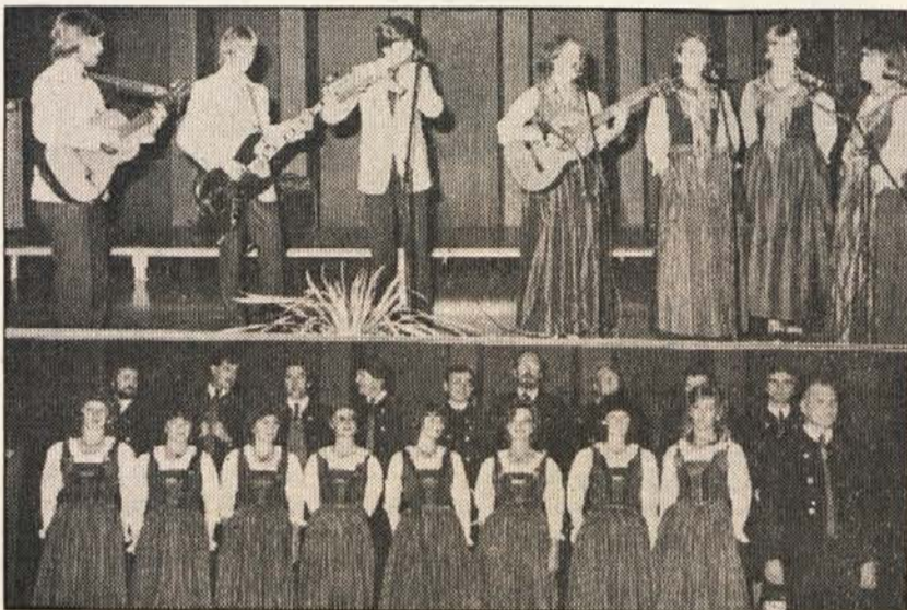
Domačini in gostje so z mednarodnim sporedom demonstrirali sožitje med narodi

Ne želimo vrednotiti in ocenjevati posameznih skupin in prispevkov,