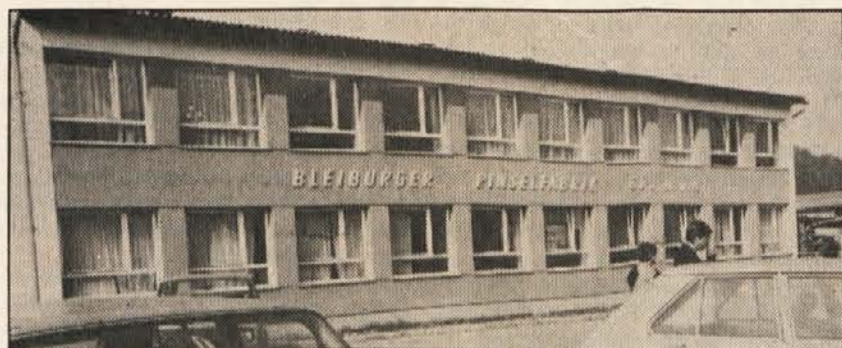
Industrijska podjetja so na podeželju le redko naseljena

predstavlja zastaranje, kar pomeni, da je delež gospodarsko aktivnega prebivalstva (starostni skupini 15-25 in 25-60 let) pod koroškim povprečjem, višji pa je odstotek otrok (okraj Velikovec 3,7% na družino, medtem ko deželno povprečje znaša 3,4% na družino). Tudi delež nihačev je nadpovprečno visok. Po podatkih iz ljudskega štetja 1971