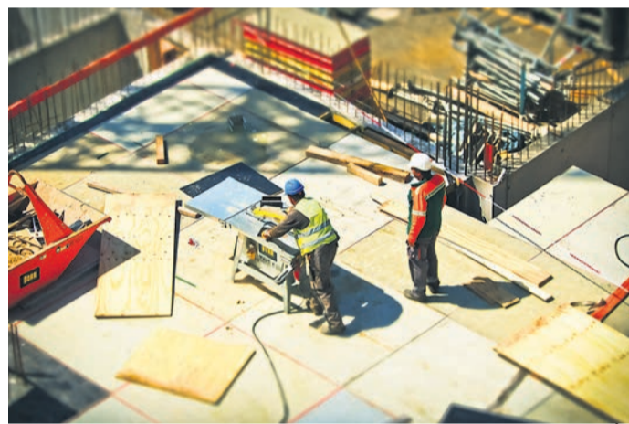
Po podatkih SURS-a je bila vrednost gradbenih del v prvi polovici letošnjega leta za 23 % višja kot v enakem obdobju lani.

Tudi pri storitvah beležimo rast vrednosti opravljenih del, v prvi polovici tega leta je ta kar za petino višja kot v enakem obdobju lani.