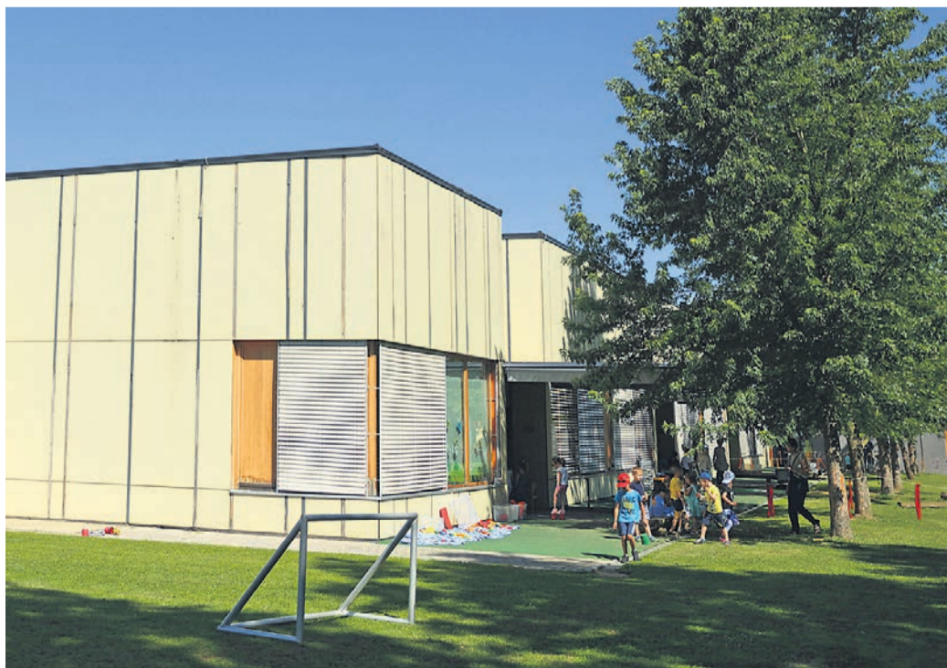
Vrtca v Cirkovcah in Kidričevem obiskuje skoraj 300 otrok.

Stroški dela v vrtcu Kidričevo so v štirih letih zrasli za skoraj 170.000 evrov. V letu 2019 so znašali 713.000 evrov, letošnji bodo glede na polletno realizacijo okoli 880.000 evrov. Za šolsko leto 2022/23 so izračunani predvideni povprečni mesečni stroški dela v višini 72.000 evrov, kar je štiri tisočake več kot v lanskem šolskem letu. Mesečni strošek živil za vseh 205 otrok v vrtcu je 9.300 evrov.