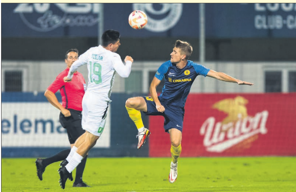
Nogometaši Celja so prvi v sezoni ugnali zasedbo Olimpije.