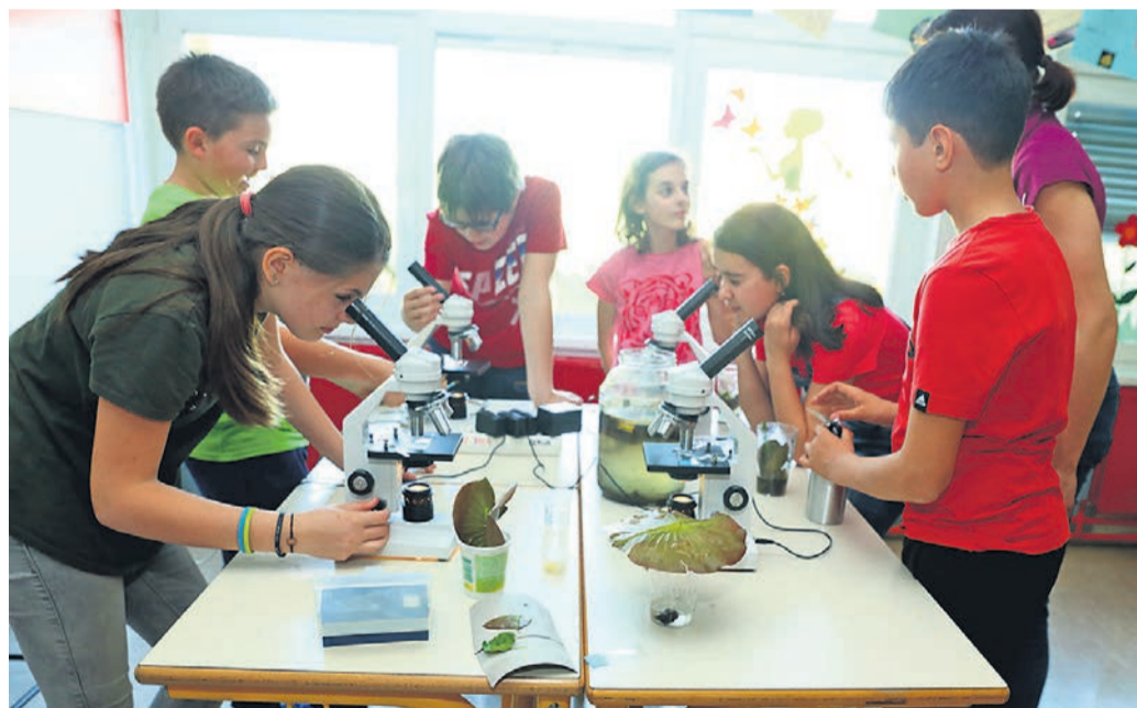
Za številne starše so brezplačni krožki dobrodošla rešitev.

ča boljše povezovanje obveznega in razširjenega programa šole,« je dejal Šterman. Na seznamu interesnih dejavnosti OŠ Ormož je več kot 40 različnih interesnih dejavnosti, od športnih, umetniških, kulturnih do poučnih vsebin.