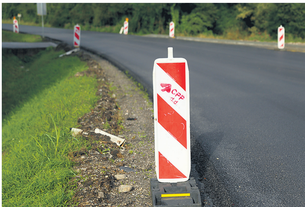
Do izbire novega koncesionarja delo na podlagi dopolnitev k pogodbi opravlja dosedanji, to je CPP.

Vlada je konec maja sprejela odločitev, da se za ptujsko-ormoško območje koncesija zaradi neizpolnjevanja kadrovskega pogojev ne podeli nobenemu izmed prijavljenih ponudnikov. V podjetju Hermes GP so se na odločitev vlade pritožili, Državna revizijska komisija pa je njihovo pritožbo pred mesecem dni zavrnila. Na DRSI so povedali, da bodo razpis za spodnjepodravsko koncesijo ponovili, objava je predvidena letos jeseni. »Gre za ponovljeni razpis, objava bo potekala po odprtem postopku, ponudbo lahko odda vsak zain-