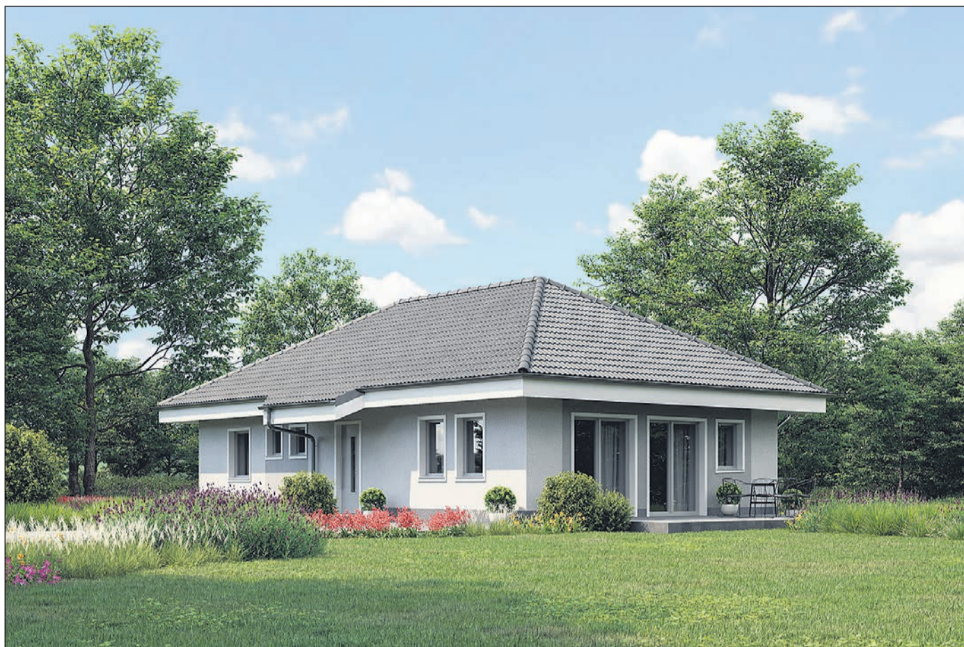
Nizkoenergijska hiša Metka s kvadratur 90 m 2 in porabo od 20 kWh/m 2 .

„V enem mesecu smo pozidali od prve vrste do strehe.“