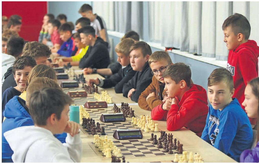
V nekaterih osnovnih šolah lahko učenci izbirajo tudi med več kot 40 različnimi krožki.