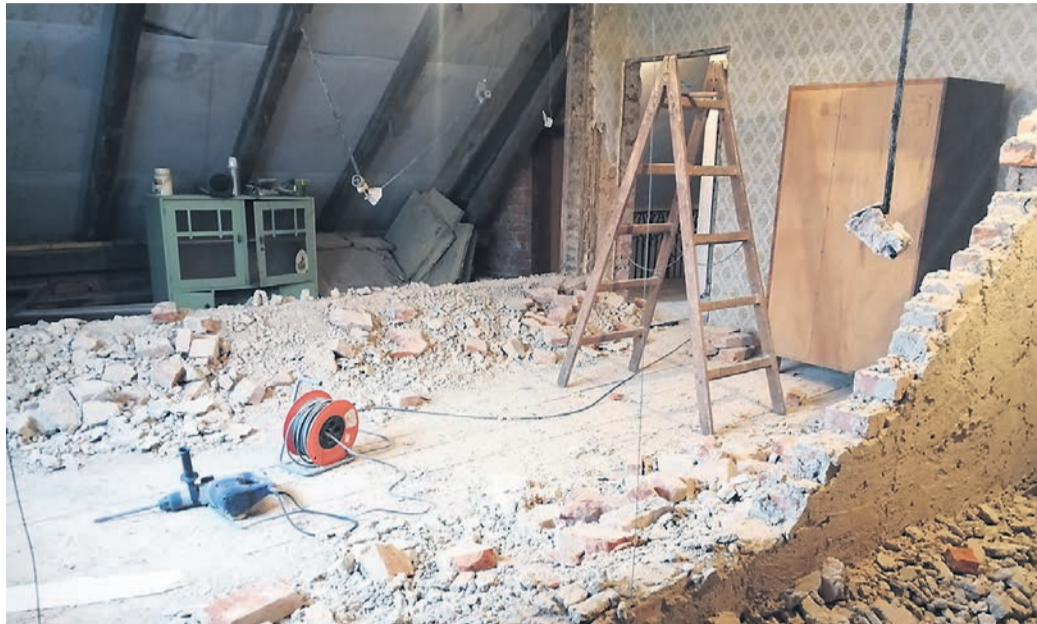
Nekateri mrzlično iščejo mojstre, drugi špekulirajo in raje čakajo, saj upajo, da se bo stanje stabiliziralo in umirilo.