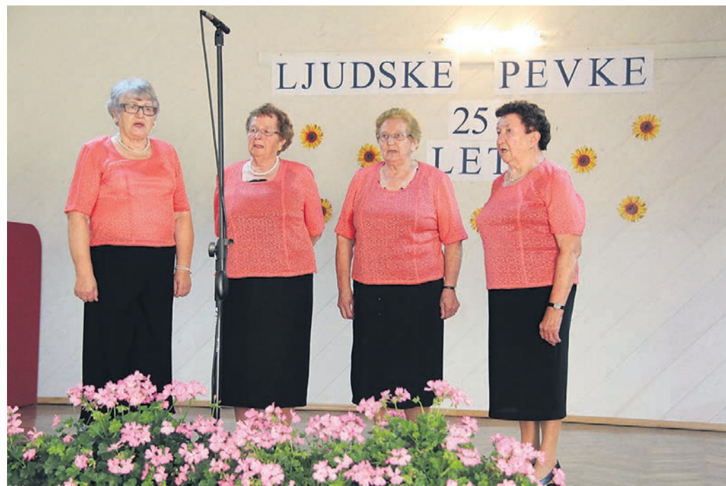
Veseli do prepevanja ljudskih pesmi jih družijo 25 let.