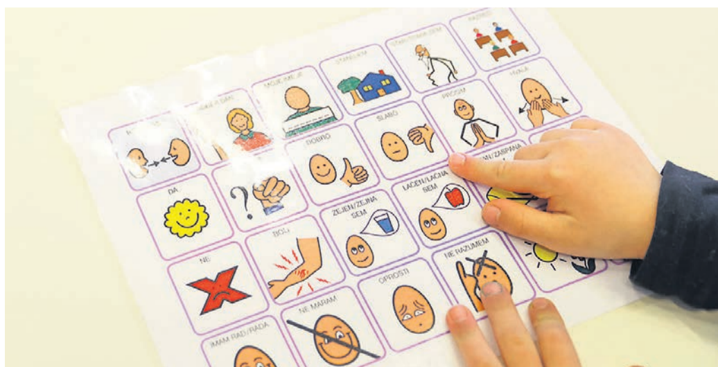
Kmalu bodo odprli še drugi oddelke prilagojenega programa predšolske vzgoje.