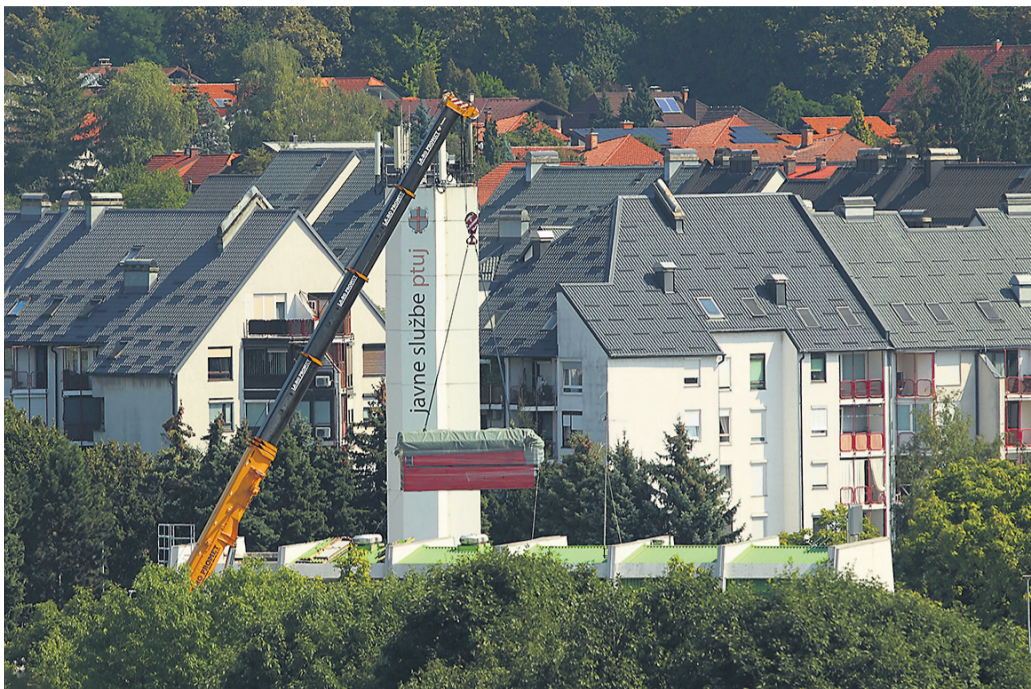
JS Ptuj bodo v posodobitev kotlovnice na Volkmerjevi cesti vložile 3,2 milijona evrov.

V občinskem podjetju so dodali, da bo posodobljena kotlovnica izjemna pridobitev za celotno območje mesta, saj gre za sodoben in okolju prijazen način ogrevanja. Za projekt so se odločili, ker so stari kotli več kot dotrajani, njihova povprečna starost je 36 let. Lani so enega zaradi iztrošenosti popolnoma izključili. Po izteku državne subvencije za kogeneracijsko napravo, ki je iz plina proizvajala elektriko in toploto, je bilo nesmotrno in predvsem drago