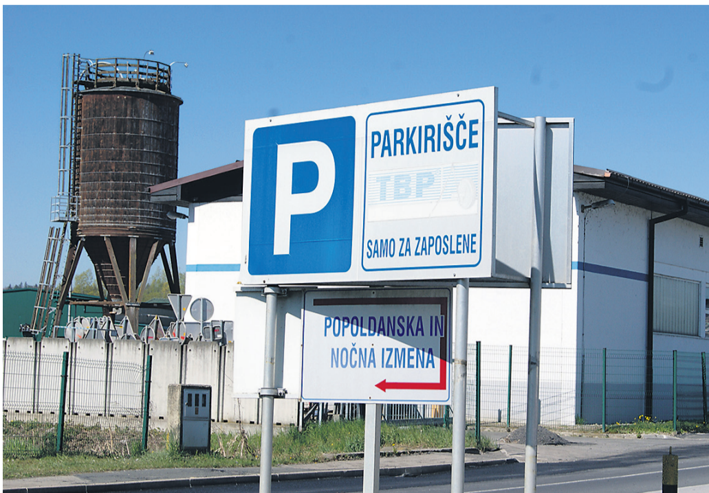
V lenarškem TBP-ju so imeli ob začetku vojne v Ukrajini težave z dobavo kabelskih setov, zdaj pa jih je udarila energetska kriza.