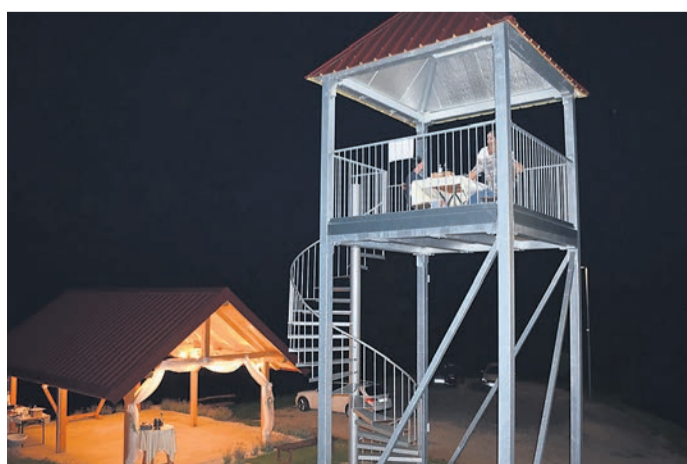
Na andraškem stolpu Ostragova si lahko privoščite romantično večerjo v dvoje.

Celoten projekt je vreden skoraj 60.000 evrov, od tega je dve tretjini evropskega denarja. Poleg stolpa z devetimi kvadratnimi metri površine so na Ostragovi uredili še 40 kvadratnih metrov velik pokrit prostor za sprejem obiskovalcev, tako da lahko tam organizirajo različne sprejeme, degustacije in prireditve, kot so denimo tradicionalno kresovanje, paralelno žakljanje in postavitve klopca. Poleg naštetega so na Ostragovi pripravili tudi kino na prostem – obiskovalci so si pod zvezdami ogledali slovenski film Šiška Deluxe. SD