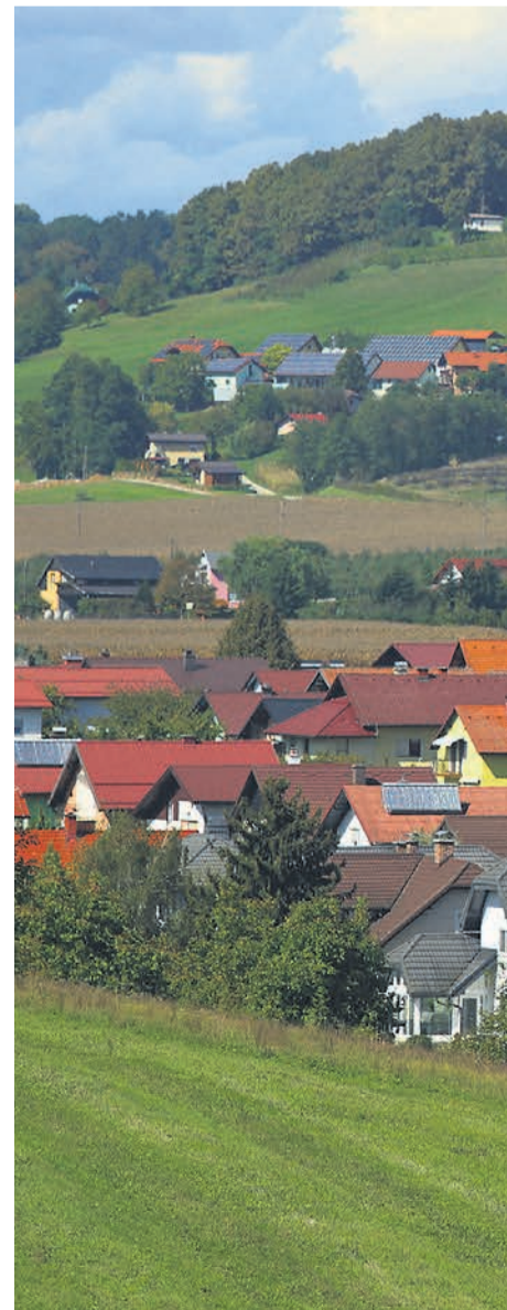
Velike razlike v obračunavanju NUSZ med občinami suvereno odločati, v kolikšni meri lastniki

Dejstvo je, da NUSZ za občinske blagajne ne pomeni tako majhnega priliva. Da bi se občine temu odpovedale, verjetno ni pričakovati. Prav tako ne, da bi dajatev, še posebej v luči vsesplošne draginje in ekonomsko vedno bolj zahtevnih časov, zmanjšale. »Minimalna in maksimalna višina dajatve z zakonom nista določeni, določena so le merila in kriteriji, ki izhajajo iz predpisov, ki določajo NUSZ in jih mora vsaka občina uporabiti pri pripravi lastnega odloka,« so povedali na Ministrstvu za okolje in prostor.