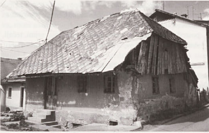
Maleričeva hiša pred obnovo. 4. 5. 1996.

od leta 2001 3 ). Obnova starega mestnega jedra v Črnomlju je aktualna šele v zadnjih letih, saj se je na Slovenskem ideja o prenovi mestnih jeder udomačila šele v šestdesetih in sedemdesetih letih, v Evropi pa se je ideja pojavila že pred 2. svetovno vojno.