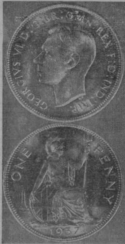
Prvi angleški kovanci Jurja VI.

Plemenski sejm za belo slovensko govedo. — Kr. banska uprava priredi dne 4. maja v Smartnem ob Paki plemenski sejm za belo slovensko (marijadvorsko) pasmo. Na sejm bodo posta-