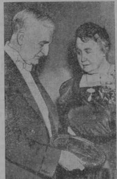
Ob 20letnici vstopa Združenih ameriških držav v svetovno vojno je izročila zunanjemu ministru Cordellu Hull vdova predsednika Wilsona Wilsonovo kolajno.