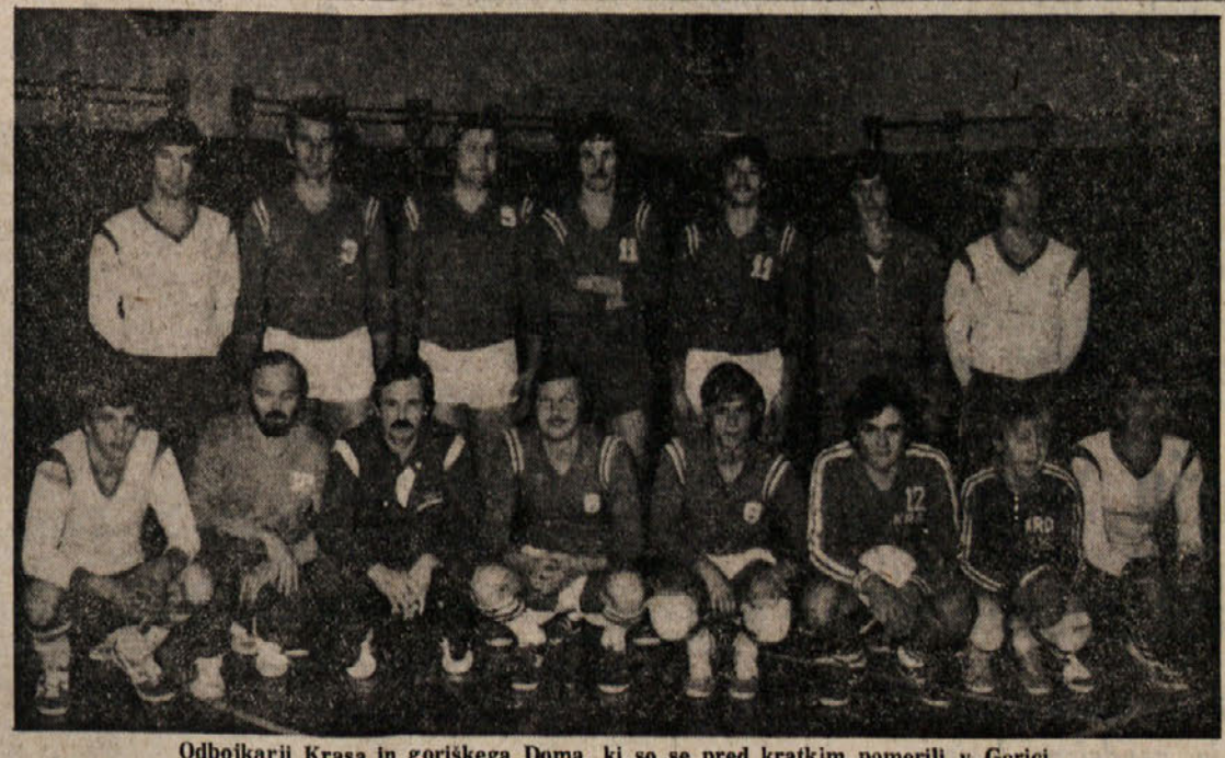
Odbojkarji Krasa in goriskega Doma, ki so se pred kratkim pomerili v Gorici

vabi vse člane in simpatizerje na zabavni večer, ki bo jutri, v četrtek, 29. 12. 1977, ob 21.30 v športnem krožku ob zaključku športnega leta 1977, skupno z odborniki in člansko ekipo.