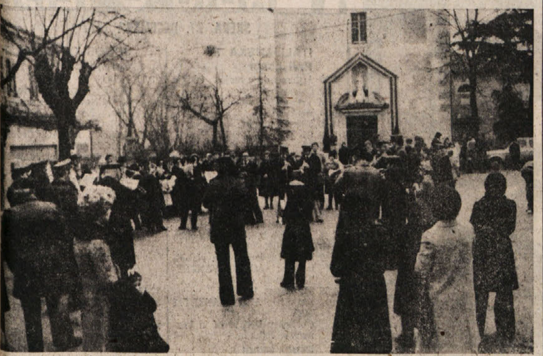
Nabrežinska godba na pihalu je vsem vaščanom na svojevraten način voščila srečno in dobro počutje med prazniki. V nedeljo jutraj so se godci iz Nabrežine zbrali na glavnem trgu in priredili tradicionalen božični koncert