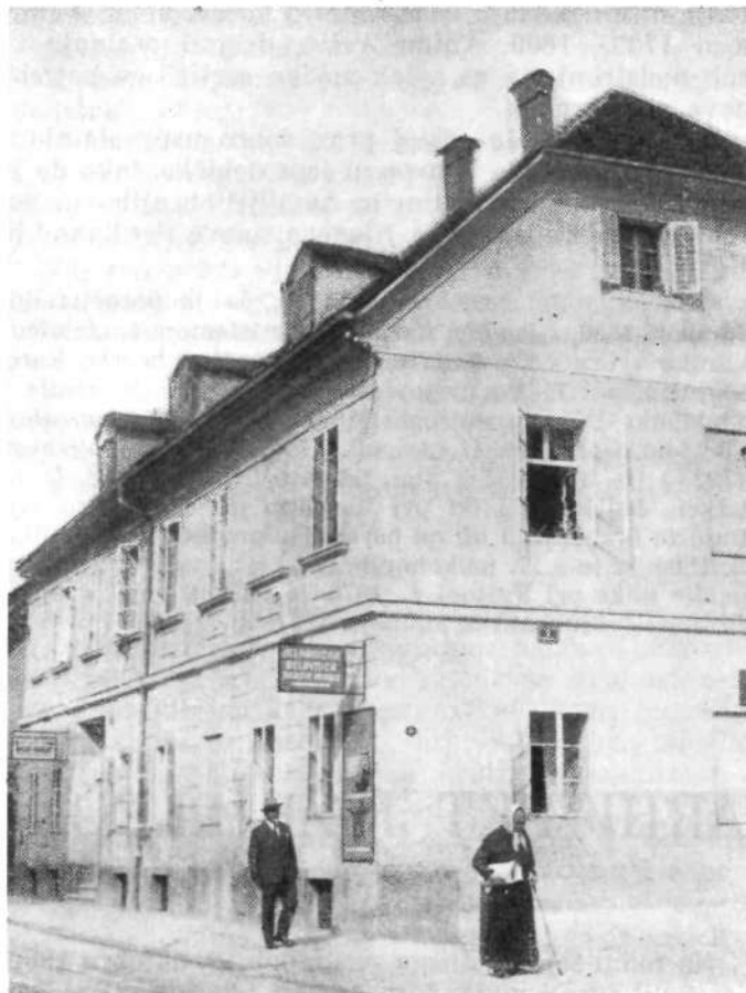
Nekdanja Schwarzova pivovarna na Poljanski cesti št. 29, danes št. 11 na oglu Bergantove ulice