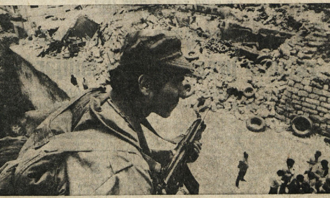
Izraelski vojak na straži v Hebronu

V zasedi ubitih pet izraelskih kolonov - 16 oseb ranjenih - Izraelske oblasti izgnale tri cisjordanske politične predstavnike