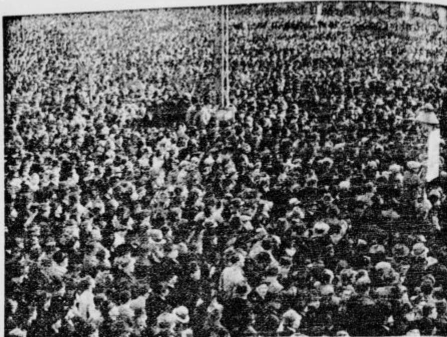
Dr. Stojadinovič govori v Novem Sadu 80.000 ljudem