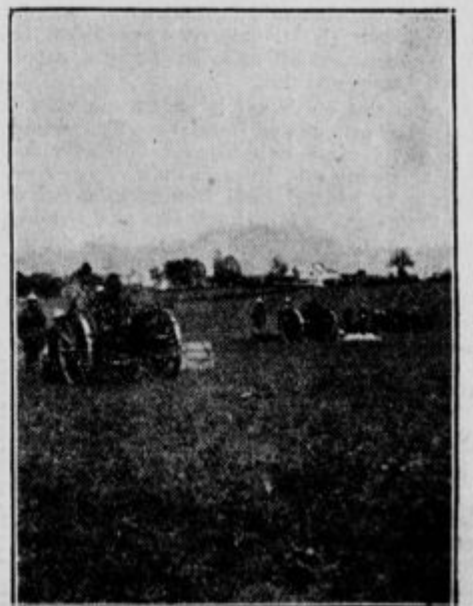
Topništvo sovražne armade.