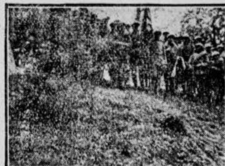
Sovražna rezerva pri Sv. Valburgi.