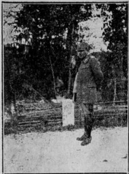
Divizionar g. general S. Tripkovič motri premit- kanje čet.

Ob pol šestih je defilirala vsa vojska pred generalom Tripkovičem, nakar je odkorakal 52. polk v Skofjo Loko, 40. pa v Ljubljano, ka- mor je dospel ob 9 zvečer. Z godbo na čelu je korakal skozi mesto v vojašnico k počitku.