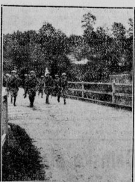
Sovražna (zahodna) armada se umika čez smleški most.