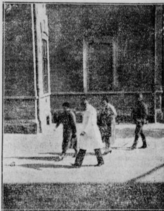
Nj. Vel. kraljica pred otroškim zavetiščem.

Ze so mislili ljudje, ki se jih je bilo v tem anogo zbralo, da bo kraljica izšla iz liceja na Blei- weisovo cesto, kjer jo je tudi pričakoval dvorni avto- mobil, ko se je kraljica nenadoma spomnila in nato amerila korak proti dvoriščnim vratom liceja. Cez tče je sprotoma stopila že do gospodinjstva šole