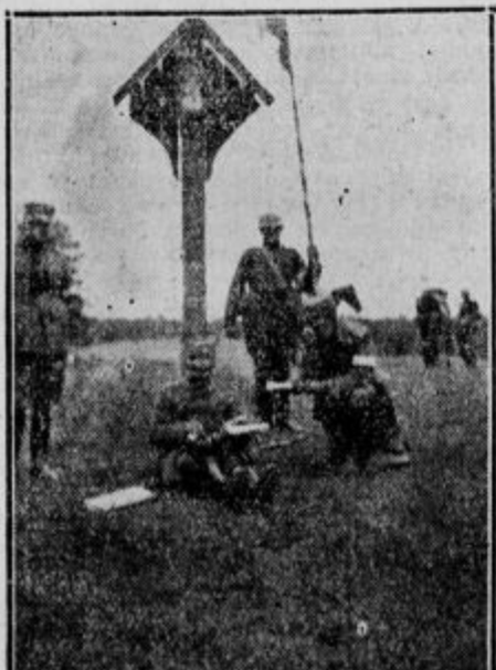
Vojska pisarna na prostem. Štab z zastavo ob križu.