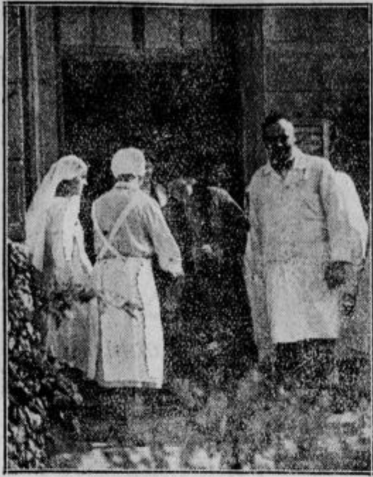
Zaščitna sestra podaja ob slovesu kraljici šopek cvetja.