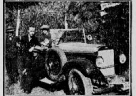
Casnikarski glavni stan za kozolecem.