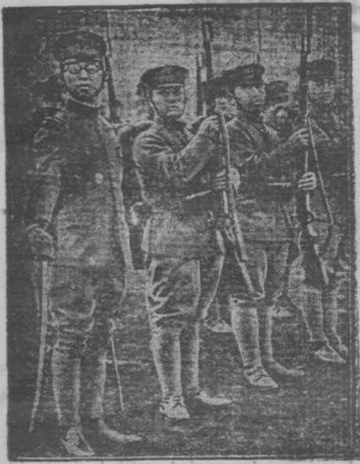
Brat japonskega cesarja vežba novince.