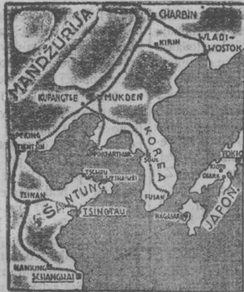
Zemljevid japonsko-kitajskega bojišča.