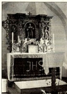
Glavni oltar nosi letnico 1681.

Zunanost cerkve je bogato okrašena s šivanimi robovi, poslikani okenskimi