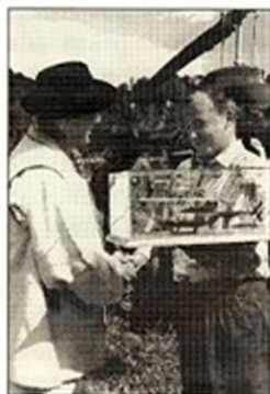
Županu je predstavnik Slovenske vojske predal maketo helikopterja Peter Klepec.

Najprej sta na trati v bližini Kolpe pod Ribjekom pristala dva helikopterja Slovenske vojske, katerih boke je krasil zanimiv grb, še zanimivejše pa je bilo ime izpisano poleg grba - Peter Klepec. V dolino svoje mladosti je Peter Klepec tega dne dobesedno