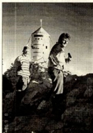
Ob 7. uri na vrhu