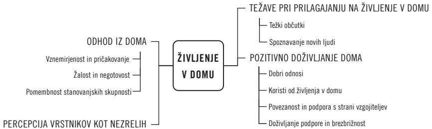
SLIKA 1: Prikaz področja Življenje v domu

dom in vse v njem.; Ker sem se navadila, bi mi bilo težko oditi iz njega.“) Svoje življenje v domu doživljajo kot veliko koristi zase, zlasti glede na življenje, ki so ga imeli v lastnih družinah („To je bilo lepo obdobje v mojem življenju, lepa izkušnja, kajti če ne bi šla v dom, kdo ve, kaj bi se zgodilo z mano. Mogoče ne bi končala niti osnovne šole ... Zelo sem hvaležna, ker sem bila v domu.“ (k2) „V osmih letih sem spoznala, da imam tukaj vse, kar prej nisem mogla imeti, vse, kar nisem mogla imeti doma.“ (k1)) V tem pogledu so doživetja nekaterih med njimi tako pozitivna, da bi jih priporočili svojim otrokom, kar niti ne čudi glede na čas, ki so ga nekateri mladi preživeli v mladinskem domu – za marsikoga je bil to dom in kraj, kjer je odraščal. Mladostniki prav tako izpostavljajo pomembnost povezanosti, ki jo občutijo z vzgojitelji ter drugimi mladimi, zato lahko sklepamo, da ustanovo zares jemljejo za svoj dom: „Mi smo velika družina. Jaz sem