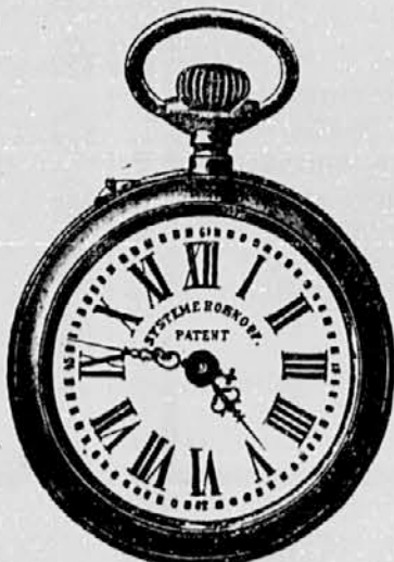
Št. 5. Nikeln. Roskopf na ka- mnih tekoča, pokrovi stano- vitni . . . . . gld. 3-20