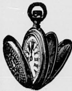
Št. 6. Srebrna cilind. s 3 pokrovi . . . . . gld. 6-50 s pozlačenim okvirj. gld. 7—