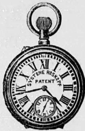
Št. 9. Roskopf lepo izde- lana . . . . . gld. 4—