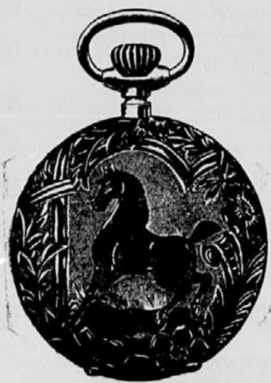
Št. 3. Srebrna anker Roskopf s 3 močnimi pokrovi, močno kolesje . . . . . gld. 8—

Bogata zaloga podob na platno in šipo z različnimi okvirji. Belgijska brušena ogledala vsake velikosti. Raz- lično pohištvo, kakor: toaletne mize, različna obešala, preproge za okna itd. Različne stolice z trsja in celu- loida, posebno za jedilne sobe. Bla- zine iz strune, afriške trave, z ži- mami in platnom na izbiro ter razne tapečarije. Reči, katere se ne naha- jajo v zalogi, preskrbijo se po izbiri cenikov v najkrajšem času. — Daje se tudi na obroke, bodisi tedenske ali mesečne. — Pošilja se tudi izven Gorice po železnici in parobrodih.