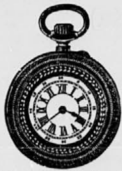
Št. 7. Srebrna cilind. lepo gravirana . . . . . gld. 6-50