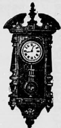
Št. 10. Ura z nihalom brez uteži 48 ur idoča . . . . . gld. 6— 8 dni idoča . . . . . 12— 14 dni idoča . . . . . 13-50

Za vsako uro jamčim eno leto pismeno. Ako cenj. naročniku blago ne ugaja, lahko vrne v teku 8 dni, ali pa se mu denar nazaj pošlje. Vse ure se pregledane in točno urejene. Cenike razpošiljam zastonj. Za obilen obisk se najtopleje priporoča udani