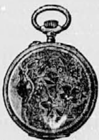
Št. 8. Srebrna s tremi moč- nimi pokrovi . . . . . gld. 7-50 74 zlata Em. . . . . gld. 19—