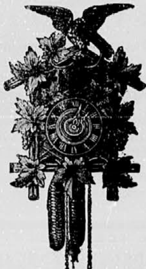
Št. 11. Ura »kukavica« lepo izrezana močno kolesje s ko- ščenimi kazalci . . . . . gld. 12-50