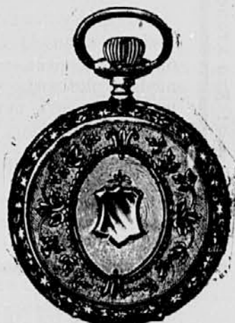
Št. 1. Srebrna cilind. rem. s 3 močnimi pokrovi, fino kolesje . . . . . gld. 6-75