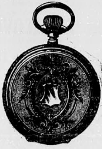
Št. 2. Srebrna anker remont. na 15 kamnov s 3 močnimi pokrovi . . . . . gld. 8-60 linejše natančno regulirane prav line . . . . . gld. 12—