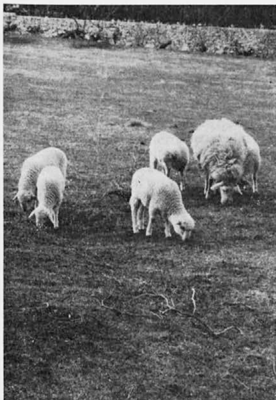
Ovce na Krasu