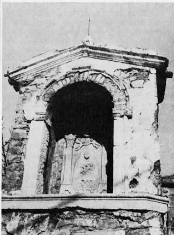
Motiv s Krmenke

»Kristus Kralj je vstal iz groba, premagana je smrt, trohnoba. ALELUJA! ALELUJA! ALELUJA!«