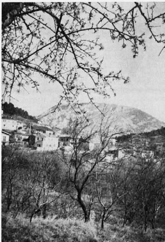
Zabrežec. V ozadju Glinščica