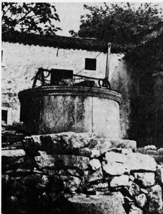
Star vodnjak (Slivno)

Na koncu so vsi izrazili zadovoljstvo ob tako dobro uspelem srečanju z upanjem, da bo srečanje vedno več med slovensko mladino.