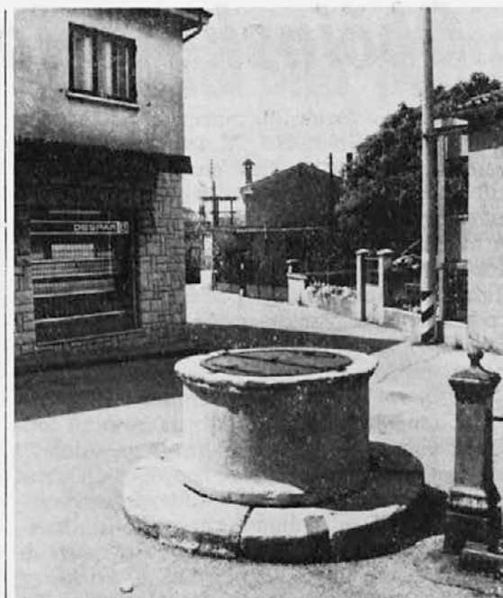
Vodnjak na trgu pri Banih

Kot kaže, se bo moralo slovensko kmetijstvo pri nas še bolj posvetiti samo nekaterim panogam, recimo vrtnarstvu, cve-