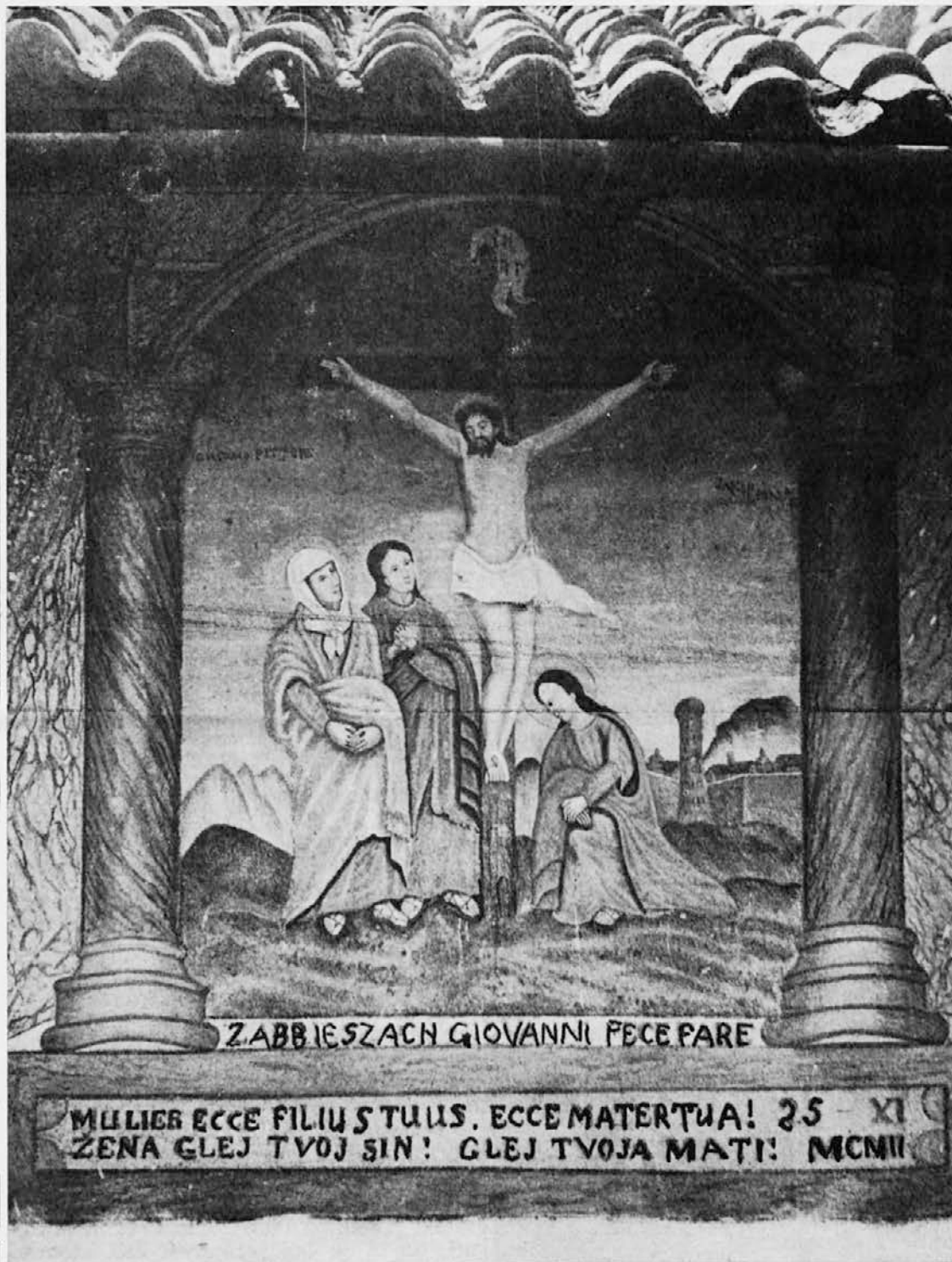
Motiv s Trčmuna (Beneška Slovenija)