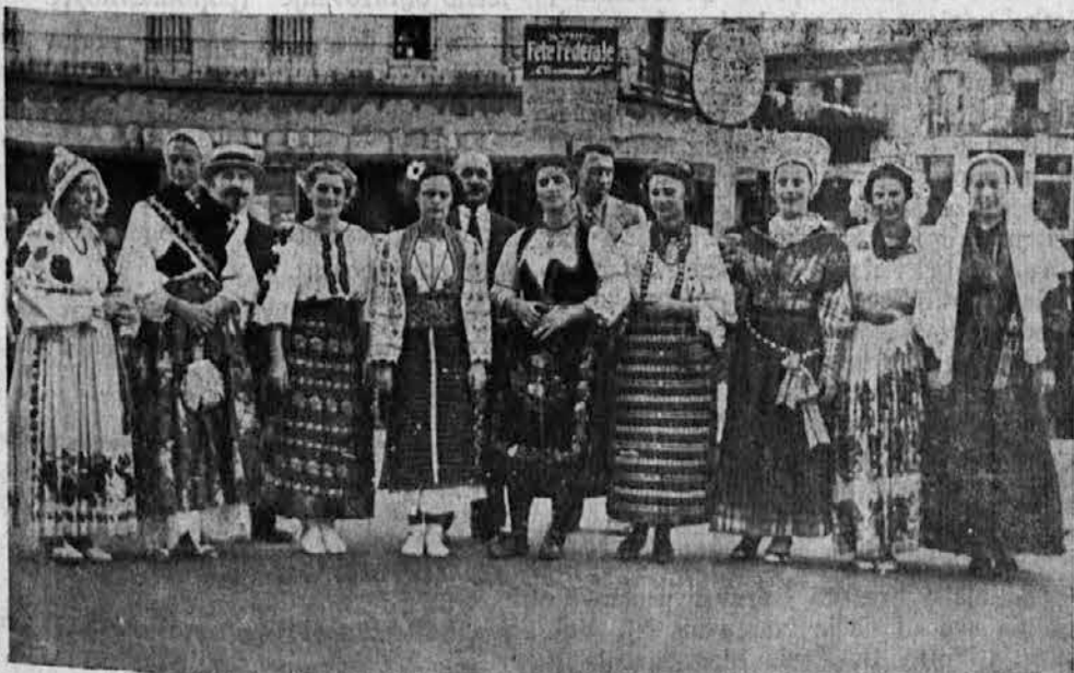
Naša ženska vrsta, koja je učestvovala na sletu francuskih gimnastičarki u Clermon Feranu od 16—18 jula o. g.

Osim prostih vežbi, koje su izvodili članovi čete te članovi gore pomenutih društava, na programu su bile pešačke i konjičke trke. Duljina staze pešačkih