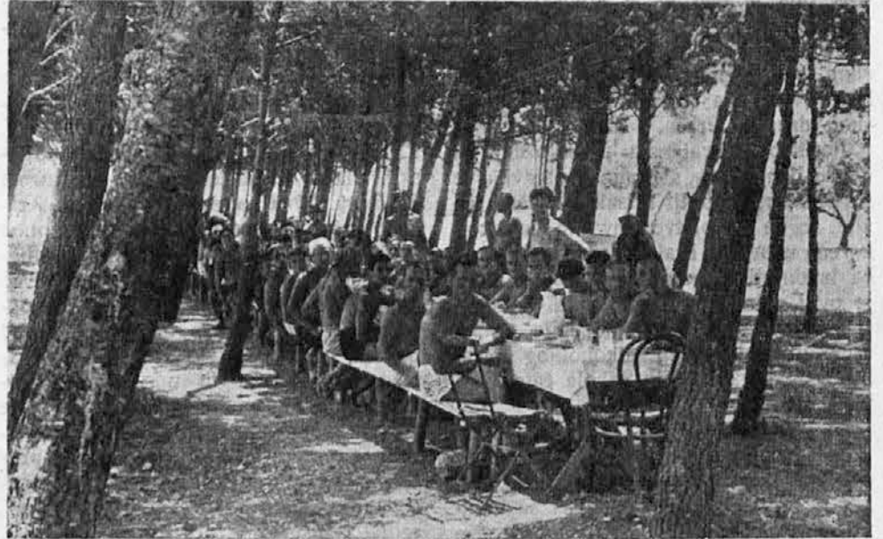
Sa prvog prednjačkog naraštajskog tečaja Saveza SKJ, održanog u Kaštel-Sućurcu od 1—20 jula o. g.

Sokolsko društvo Gradačac priredilo je zajedno sa srpsko-muslimanskim kulturnim i prosvetnim društvom „Gajret” svečanu proslavu rođendana Njegovog Veličanstva Kralja Petra II.