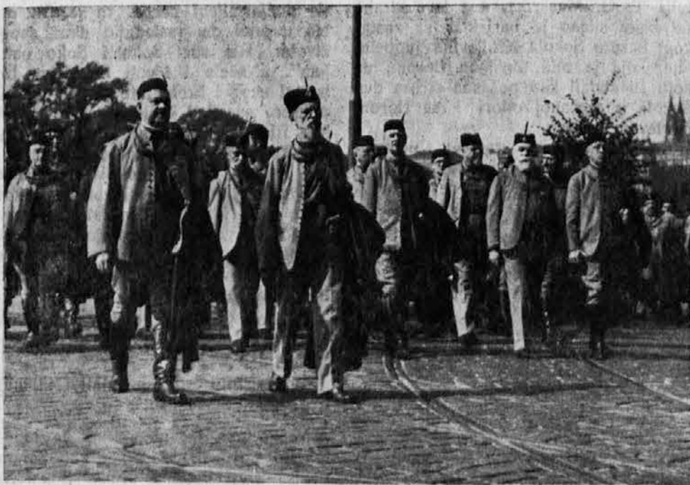
Pretstavnici češkoslovačkog i jugoslovenskog Sokolstva na sprovodu T. G. Masarika

Jedinstvenom jasnoćom Masarik je obrazložio savremenim generacijama, kakav je zadatak čoveka u čovečjem društvu, kakvi moraju da budu njegovi odnosi prema bližnjemu i prema Bogu.