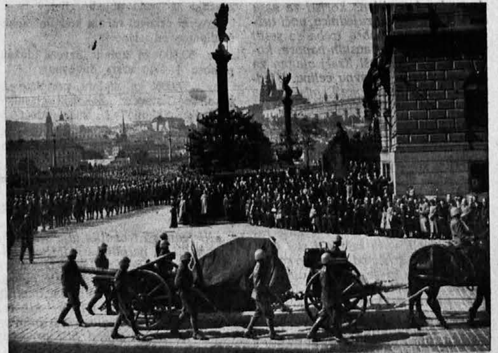
Lafet s posmrtnim ostacima Pretседnika-Osloboditelja T. G. Masarika