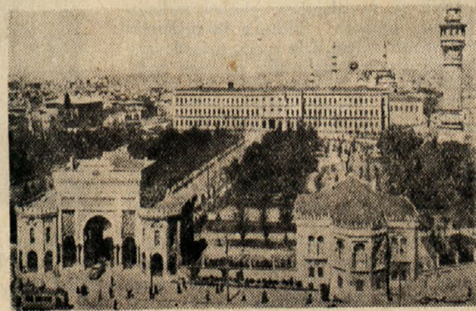
Univerza v Carigradu, največjem in nekdanjem mestu Turčije

Pomembno politično aktivnost razvija Turčija v okviru balkanskega pakta, v katerem se skupno z Jugoslavijo in Grčijo bori za čim tesnejše prijateljstvo med narodi jugovzhodne Evrope in s tem za zagotovitev miru v tem delu sveta. Trenutni obisk maršala Tita v Turčiji, na povabilo turškega predsednika republike Dželala Bajara, je eden izmed mehanizmov na tej poti, po kateri sodobna Turčija smelo koraka iz nedavne zaostalosti v moderno napredno državo.