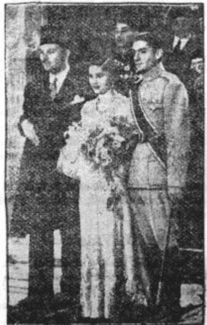
Sestra egiptskega kralja Faruka, princeza Fawzija, ki se je nedavno poročila s sinom kralja Iraka.