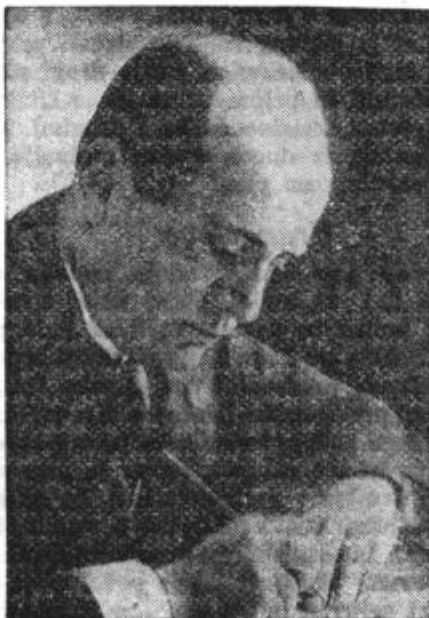
BENITO MUSSOLINI, vodja fašistične Italije, ki je te dni izjavil, da vlada na Jadranskem morju že dve leti mir in je ob tej priliki uradno navedel, da obstoje med Italijo in Francijo odprta vprašanja glede Džibutija, Sueškega prekopa in Tunisa.

takšen, da je potrebna koncentracija vseh sil in sporazum med velesilami.