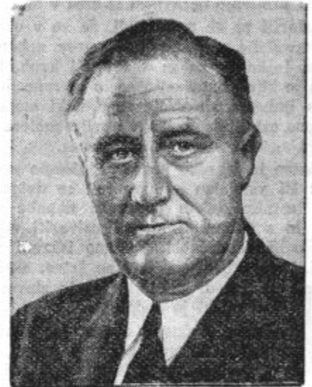
FRANKLIN ROOSEVELT, predsednik Združenih ameriških držav, ki je sklenil do zob oborožiti svojo državo, tako da bo najmočnejša vojaška sila v zraku in na morju.

Z veseljem lahko ugotavljamo samo to, da pomeni Mussolinijev zadnji govor za nas olajšanje.