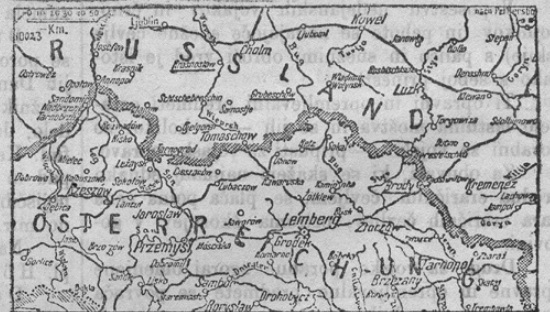
Karte zuden Schlieffen in Süd-Polen.

Velikanski boji na južnem Poljskem in ob gališki meji razburjajo celi svet, kajti te orjaške borbe svetovna zgodovina še ne pozna. Gotovo je, da se bode ta velikanska borba končala z zmago avstro-ogrškega orožja. Voditelji naših armad zasledujejo brzkone isti načrt, kakor se je Nemcem v vzhodni Pruski že posrečil. Avstrijska ofenziva proti severu se je uspešno uresničila. Vojaštvo zavzelo je linijo južno Lublina-Krasnostasa-Grubehova. Ta linija leži že 60 kilometrov od meje. Desna avstrijska skupina, ki se razteguje čez Brody proti jugu ob gališki meji, ima pred seboj mnogo močnejšo rusko armado. Vkljub temu se ji je posrečilo, vstaviti rusko napredovanje. S tem je popolnoma svojo nalogo izvršila; kajti odločitev padla bode na drugem krilu. Severno-vzhodno od Lublina, kjer so Avstrijci že došli, leži Rokótno-močvirje; to je največje rusko močvirje. Tam se velike množine vojaštva ne morejo gi-