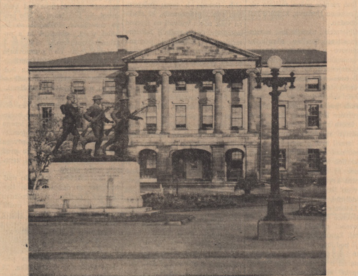
Pogled na staro parlamentno poslopje v Charlottetown P.E.I., kjer so začeli leta 1864. leta z načrti za kanadsko konfederacijo. Poslopje uporabljajo sedaj pokrajinska ministerstva. — Globe and Mail — Can. Scene.

Komunističnemu režimu v Beogradu so že nekaj let delali preglavice Slovenci, tudi komunisti, ki jim ni moglo biti prav,