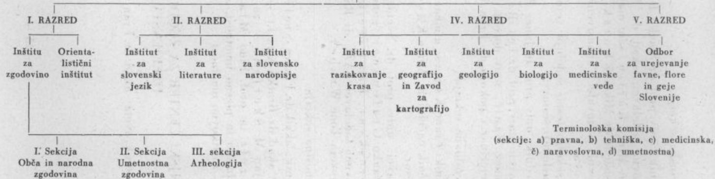
Preglednica organizacije Slovenske akademije znanosti in umetnosti