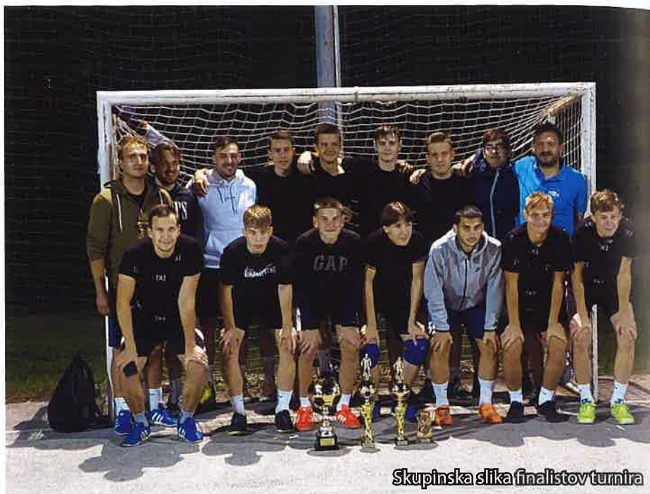
Skupinska slika finalistov turnira

Tekmovanje je potekalo v štirih skupinah. V dveh skupinah so bile tri ekipe, od katerih je napredovala ena v naslednji krog, v drugih dveh skupinah pa so bile štiri ekipe, od katerih sta v naslednji krog napredovali dve ekipi. V naslednji krog je torej napredovalo šest ekip, ki so se pomerile v treh tekmah. Iz vsake tekme so napredovali zmagovalci. Tako smo v finalu imeli tri ekipe, ki so se pomerile