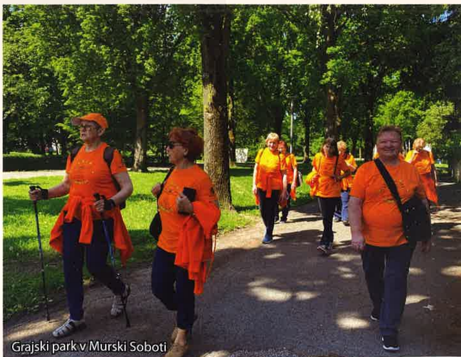
Grajski park v Murski Soboti

Ko se vračamo z naših izletov, smo vedno napolnjene z novimi vtisi o bogastvu naše kulturne in naravne dediščine. Nismo utrujene, temveč z zadovoljstvom ugotavljamo, kako nam je lepo. Izleti nas bogatijo, polni pa so tudi smeha in otroške igrivosti.