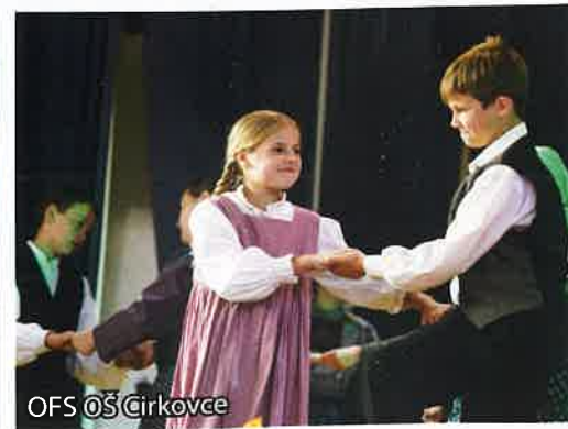
OFS OŠ Čirkovce