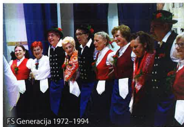
FS Generacija 1972–1994