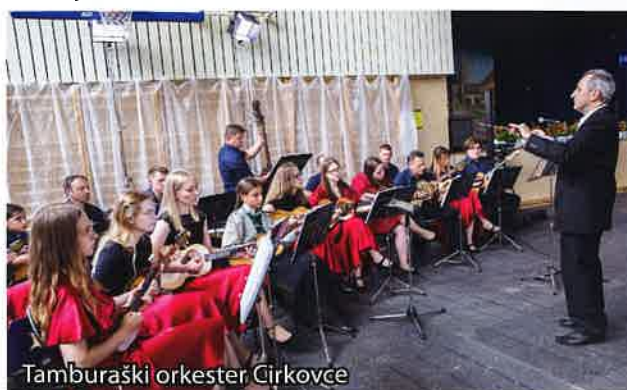
Tamburaški orkester Čirkovce