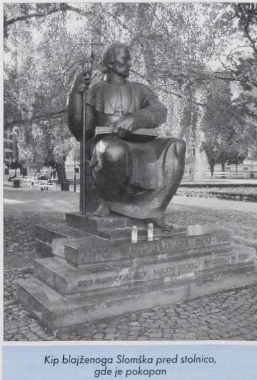
Kip blajženoga Slomška pred stolnico, gde je pokopan