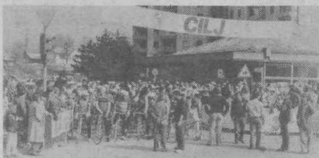
Ob desetih se je pričelo zares. Kolesarji so se odpravili na 90 km dolgo pot do Kamniške Bistrice in nazaj. Skoraj vsi so premagali - za začetek sezone - dokaj naporno progo.