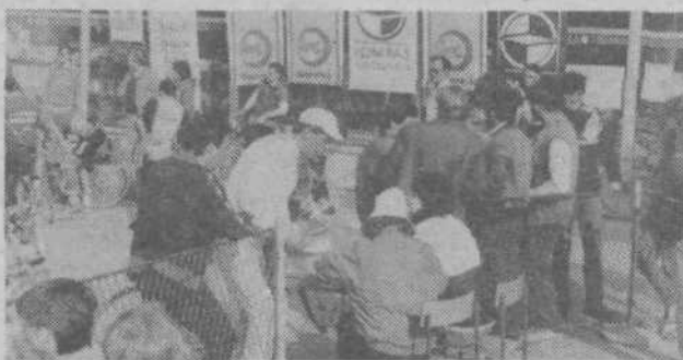
Štart maratona je bil pred samopostrežno trgovino na Črnučah, kjer so se prvi kolesarji pričeli zbirati že v ranem jutru.

21. aprila so kolesarski delavci Črnuč pripravili kolesarski maraton s Črnuč v Kamniško Bistrico in nazaj, ki se ga je udeležilo skoraj 1000 kolesarjev. Prireditelj je bila nekakšen uvod v sezono rekreativnih prireditev za kolesarje in je izvrstno uspela. Tokrat si lahko ogledate še nekaj fotografskih posnetkov z maratona.