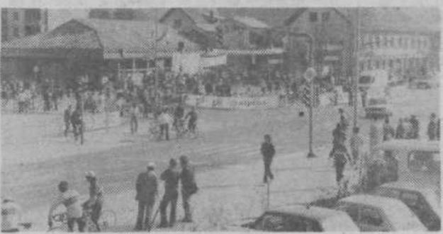
Na koncu prireditve so se kolesarji in Črnučani razšli s pozdravom: na svidenje prihodnje leto na četrtem maratonu.