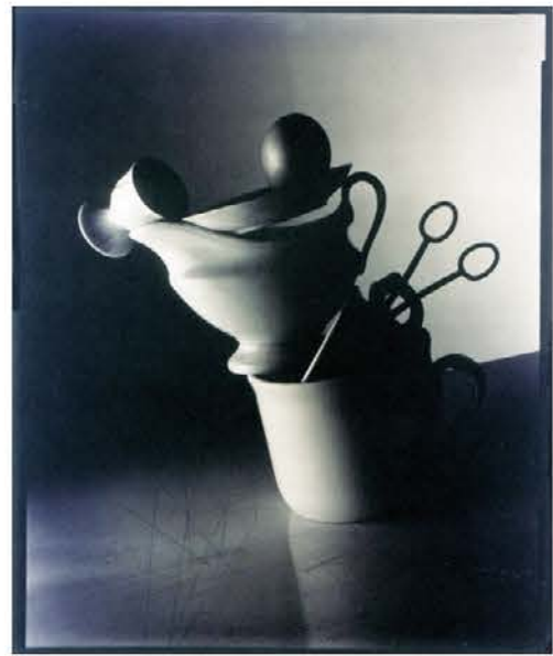
Ravnovesje / 2005

tu pa tam kot nekakšna cezura prekinja vdor zunanjega sveta in posega v njihovo intimno, zaprto okolje. Vsak Gaberščikov posnetek je svet zase, v njem so različni predmeti, izvzeti iz vsakdanjega okolja, izvzeti iz svojega konteksta in med seboj povezani v nove odnose na nevtralnem ozadju. Njihova razmerja so lahko logična, absurdna, povezana ali ne, avtor se včasih navezuje na fotografске mojstre iz preteklosti, uporablja glasbene, slikarske citate, posega pa tudi v lastno preteklost z motivi, za katere samo on ve, kaj resnično pomenijo in na kaj ga spominjajo. Takšne konstrukcije dobivajo na njegovih posnetkih svojevrstno vsebinsko in likovno, formalno konotacijo. Različni predmeti, materiali, strukture pripovedujejo nove zgodbe na vsaki novi postavitvi, istočasno pa dobivajo njihove oblike, volumni,