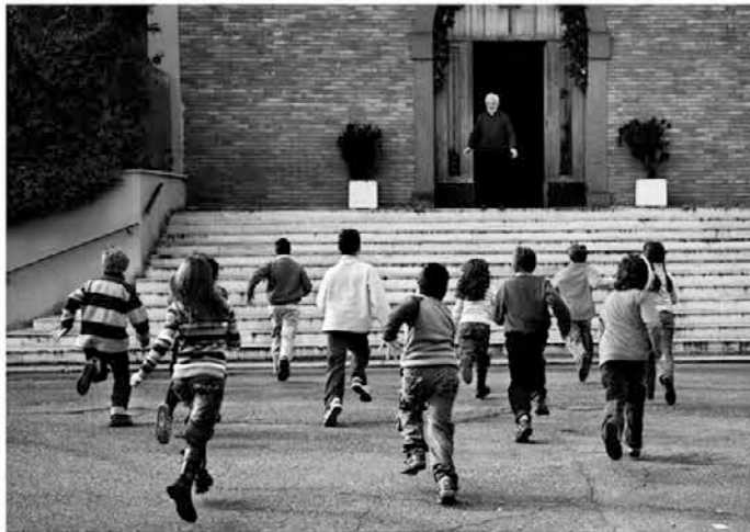
Rim, župnija sv. Nadangela Mihaela