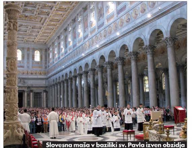
Slovesna maša v baziliki sv. Pavla izven obzidja