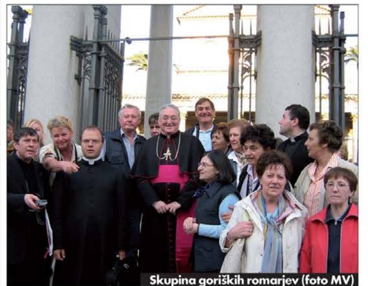
Skupina goriških romarjev

ligioznost in jo iščejo tudi v oblikah, ki so manj zahtevne od besed v evangeliju. Vse to vodi v brezbrzičnost, ki mu lahko rečemo tudi verski relativizem, iz katerega izhaja moralni relativizem. S Pavlovega groba so romarji odšli z vabilom, da bi bilo njihovo življenje