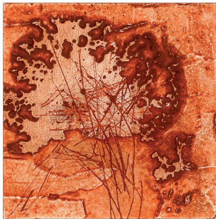
2007 / kolografija