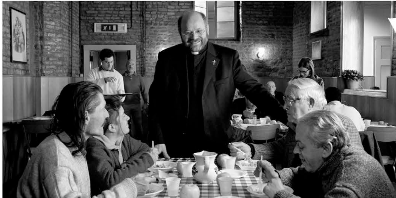
Benetke, menza Caritas

In v tem primeru ne samo ne bomo znoreli, ampak se bomo počutili prav dobro.